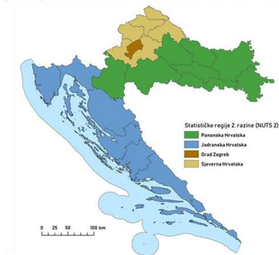
SLIKA 5: NOVA PODJELA RH NA 4 STATISTIČKE REGIJE 2.RAZINE (NUTS 2)