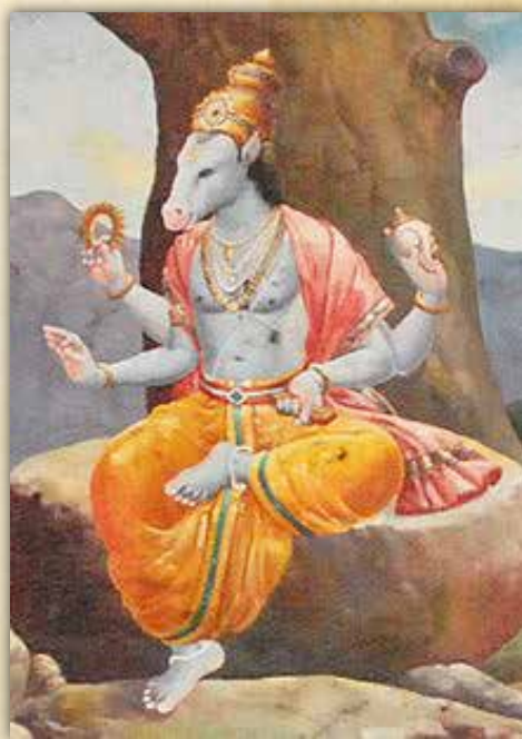
Slika 3. Hayagriva

14.1.2. Kentauri (grč. Κένταυροι , Kéntauroi ) bića su su iz grčke mitologije u kojoj su prikazivani kao stvorenja koja imaju gornji dio tijela osobe i donji dio konja (Hiron, Fol i Nes) (Vezinger, 2017). U starom Rimu mazga i konj sveti su rimskom bogu Consusu.