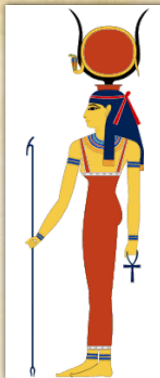
Slika. 2. Hathor s rogovima i Suncem ( https://hr.wikipedia.org/wiki/Hathor )

2.3.8. Bir Kuar ili Birkuar, poznat i kao Birnath , hinduistički je bog stoke kojemu su se klanjali pastiri Ahirsi iz zapadnog Bihara u Indiji. Smatra se oblikom boga Krišne.