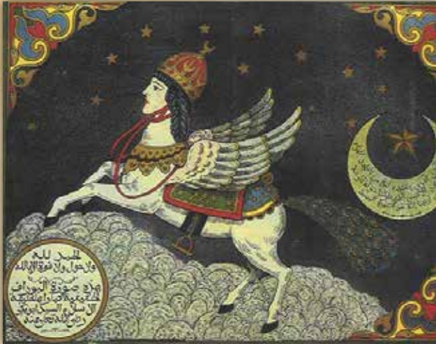
Slika 4. Burak na Mogulskoj minijaturi iz 17. stoljeća

14.1.6. Burak je stvorenje iz arapske ikonografije koje ima glavu čovjeka i tijelo krilatog konja. Najčešće se spominje u priči o poslaniku islama Muhamedu s. a. v. s. ( Salla Allahu alejhi we sellem ).