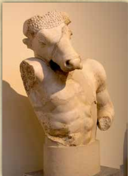
Slika 1. Minotaur, kopija starije skulpture, 1664. ( https://hr.wikipedia.org/wiki/Minotaur ).

2.1.4. Minotaur je u grčkoj mitologiji stvorenje s glavom bika i tijelom čovjeka, a u nekim je situacijama prikazan s repom i stražnjim dijelom tijela bika (Anonymous, 2022.a).