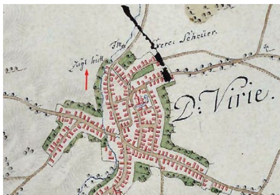
Sl. 1. Lokacija poljske ciglane u Virju

557 žitelja. Procijenjena šteta iznosila je oko 100.000 forinti. 2