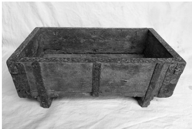
Sl. 4. Kalup za izradu opeke

18. Vu pečenju pako cigle najveći posel i kunst stoji da se cigel pervo dobro na suhome mestu osuši i da ga dešč ne opere. Da sirov i moker vu peč ne dojde. Vitri da ne vuku koji bi vatru na jednu stranu otpuhavali. Peč ispr-