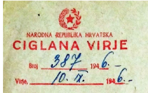
Sl. 8. Detalj zaglavlja s dopisa Kotarske ciglane u Virju

prehranu radnika dobavljala potrebne namirnice, što se vidi u popisu sljedovanja. Tako je za razdoblje od 5. – 12. srpnja nabavljeno: 36 kg graha, 1,5 šećera, oko 8 kg masti, preko 20 kg brašna, 4 kg soli, 115 kg krumpira i po 10,5 kg mesa i slanine. 51