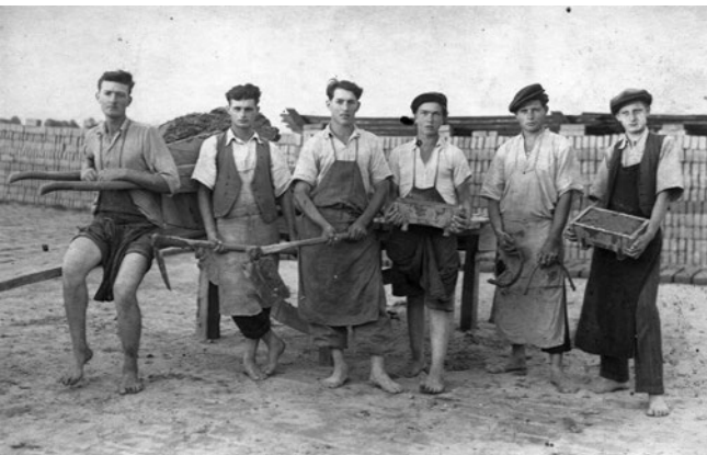
Sl. 3. Radnici ciglane u Virju

jepi za stijenke. Punjač bi rukama umijesio potrebnu količinu gline, snažno ubacio u kalup i poravnao, a zatim oštrim nožem odrezao višak u razini kalupa. Nosači su odnosili napunjene kalupe i istresali ih na daske za sušenje, a prazne kalupe vraćali na stol. Sirove opeke sušile su se na suncu i vjetru 10 – 20 dana. 19 Takva proizvodnja opeke slikovito je opisana u Gospodarskom pravilniku (Regulamentum domaniale) Ivana Adamovića iz 1774. godine, napisanom mješavinom kajkavštine i ikavštine, o kojem je pisao Ivan Tinodi. On donosi nekoliko točaka: