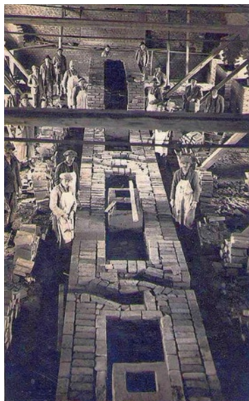
Sl. 5. Gradnja kružne peći

Za vremena Vojne krajine takve su ciglane pekale opeku za vojne objekte i crkve, a potom i imućnije žitelje. Cjelokupan rad padao je na leđa graničara muškaraca od 18 do 60 godina, a pripadao je obveznoj raboti. Zimi su pak u šumi sjekli potrebno drvo, cijepali ga u kalanice i dovozili do ciglane. Svaki obveznik rabote morao je izvesti jedan hvat drva. U protivnom je kažnjavao zatvorom i batinama. Sav posao nadgledao je mjerodavni časnik i o tome izvještavao kapetaniju. Pečenje opeke za privatne potrebe moralo se na vrijeme prijaviti kapetaniji. 22 Nakon razvojačenja ciglane su pripale općinama i zemljišnim zajednicama. Posao je vodio općinski ciglar,