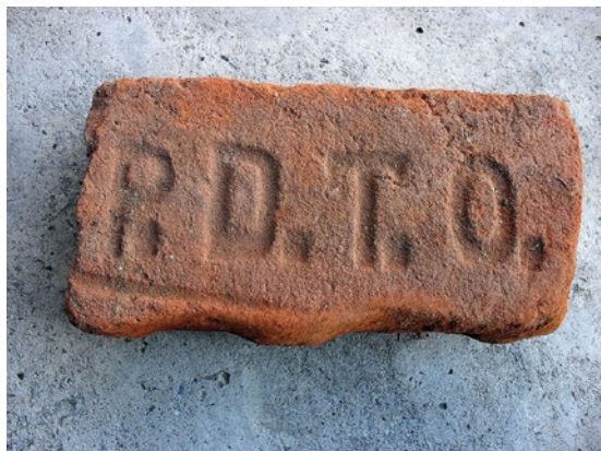
Sl. 7. Opeka proizvedena na ciglani u Virju s oznakom inicijala tvrtke Podravsko dioničko društvo tvornica opeka u Gjurgjevcu