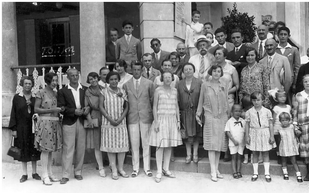
Sl. 2. Ludbreški Židovi na izletu u Rogaškoj Slatini, 14.8.1937.