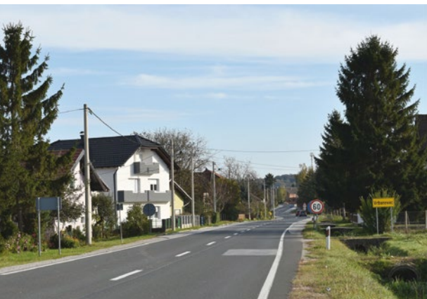
Sl. 1. Vrbanovec se nalazi na zapadnom ulazu u općinu Martijanec.