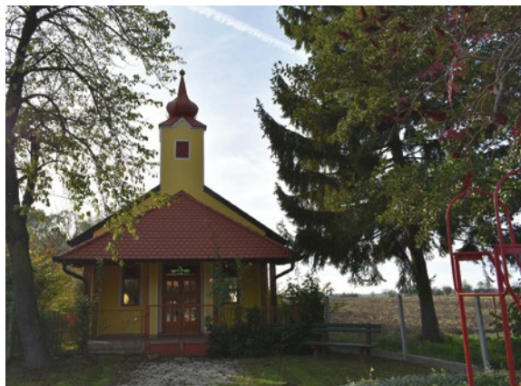
Sl. 2. Kapelica svetog Petra i Pavla iz 1892. godine, uz koju se nalazi i dječje igralište.