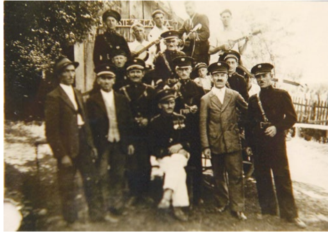
Sl. 4. Članovi Društva ispred prvog vatrogasnog spremišta, »spremišta gasila«, izgrađenog 30-ih godina 20. stoljeća.

DVD Martijanec početkom tridesetih godina prošlog stoljeća više nije jedina organizacija ove vrste na području tadašnje Općine Martijanec. U to su vrijeme uz njih aktivni DVD Vrbanovec, DVD Slanje i DVD Poljanec. Po završetku Drugog svjetskog rata na području današnje općine Martijanec osnivaju se dobrovoljna vatrogasna društva u svim ostalim naseljima, bivajući članicama vatrogasnih asocijacija na razini ludbreške regije odnosno bivše Općine Ludbreg. Preustrojem vatrogastva