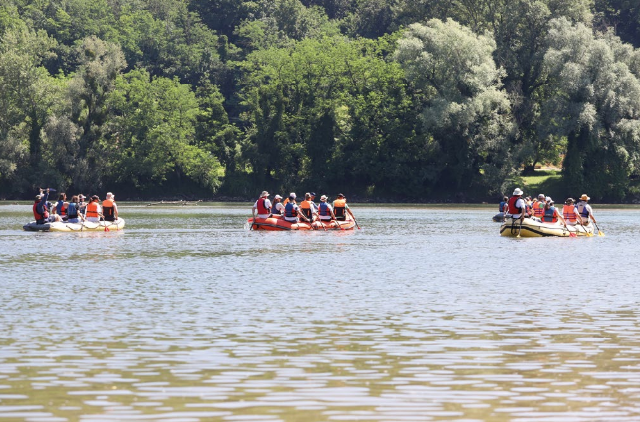
Putovanje rijekom za hrabre i željne boravka u prirodnom okruženju.