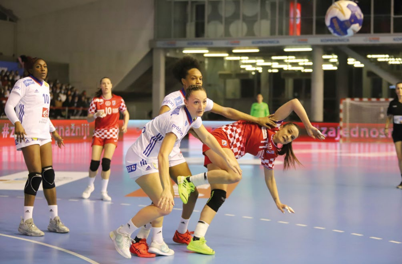
Rukometašice RK »Podravka« ozbiljnih lica prate loptu. Pitamo se gdje je završila.