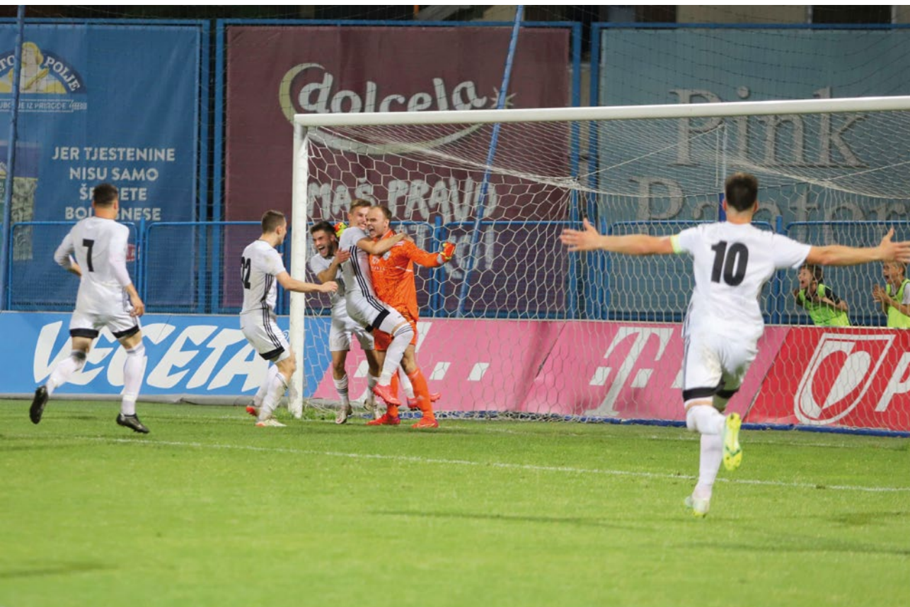
Finale Županijskog nogometnog kupa između NK Tehničar i NK Radnik Križevci.