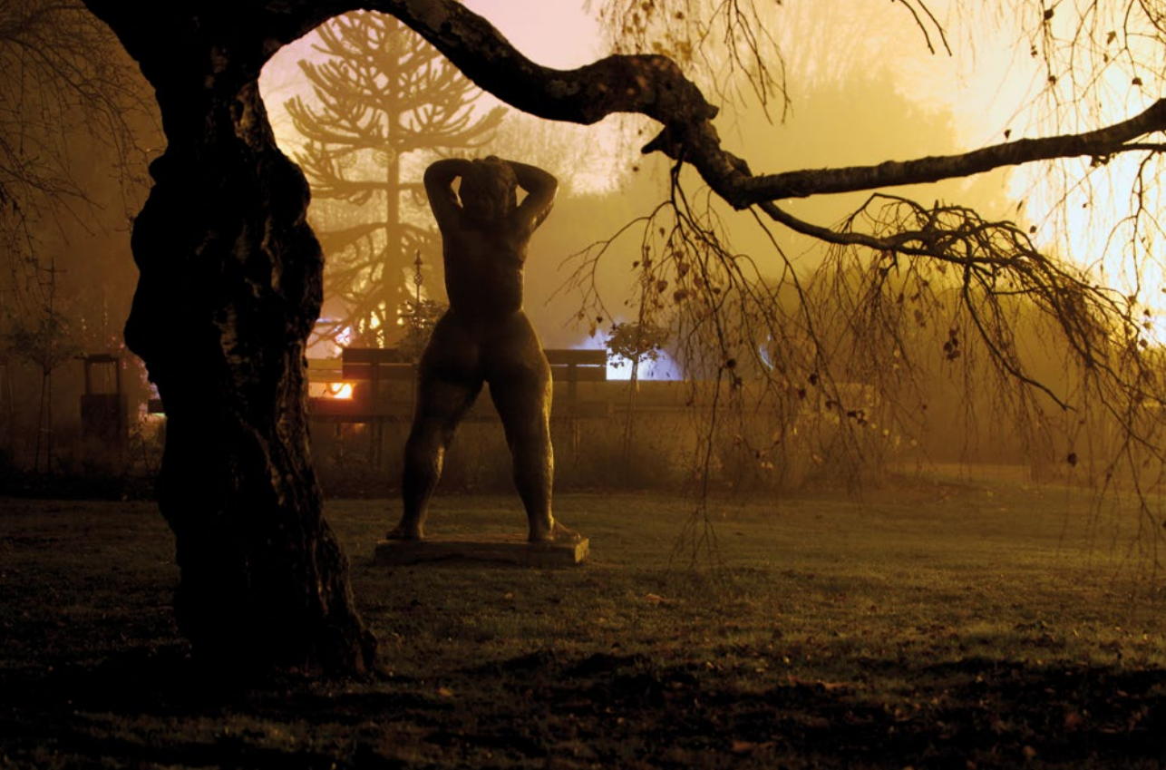
Zamagljeni pogled iz koprivničkog središnjeg parka.