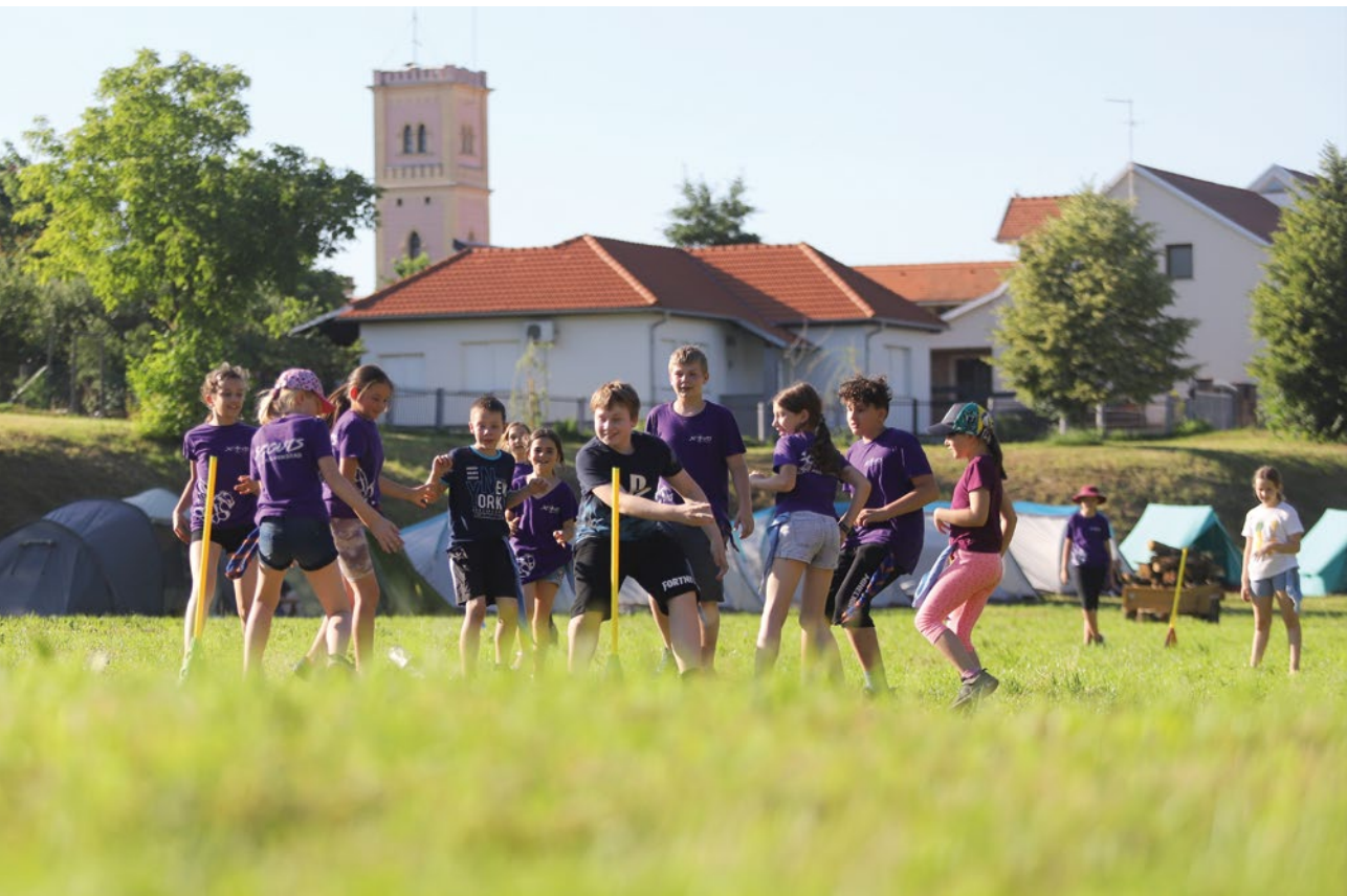
Dokaz da se i mlade generacije znaju zabavljati igrama na otvorenom.