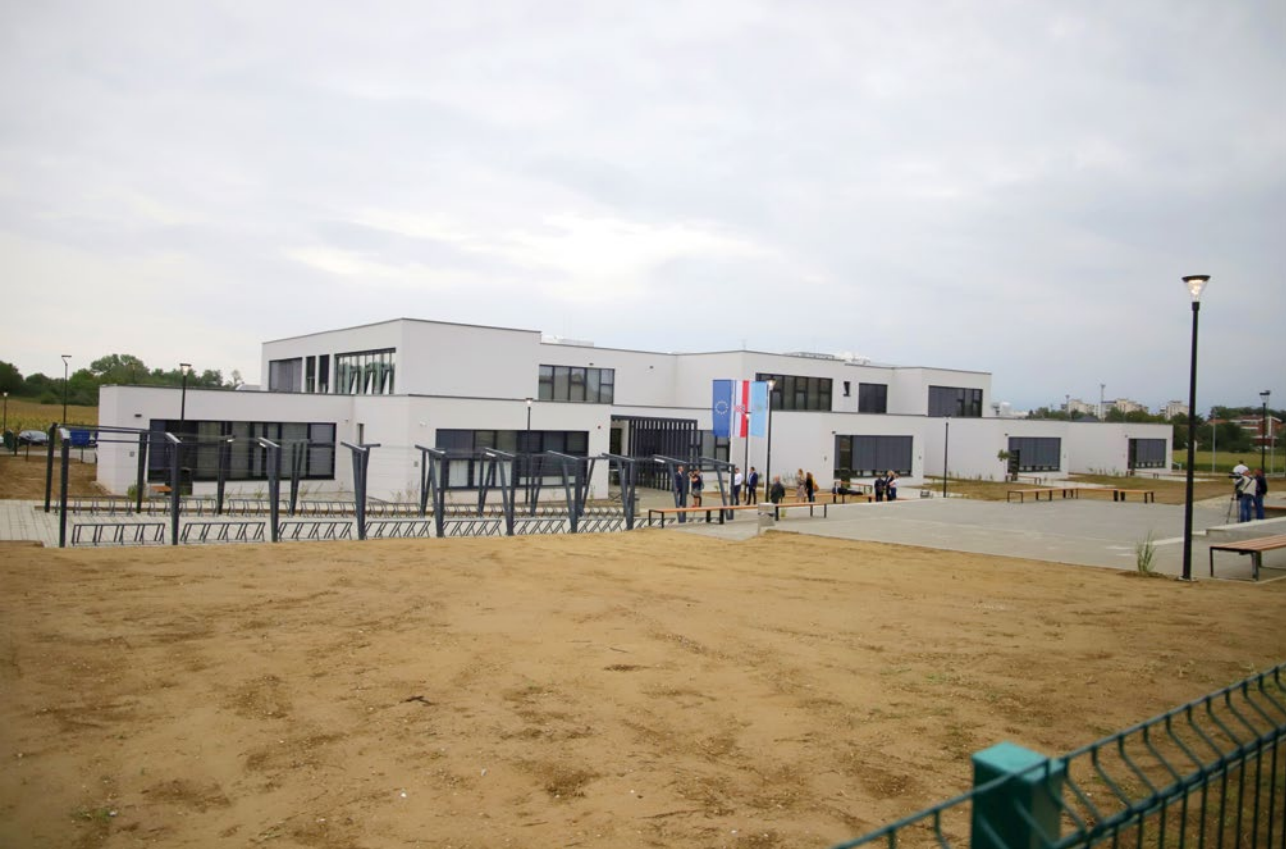
Danas zgrade izgledaju potpuno drukčije. Nova škola u Koprivnici očekuje svoje đake.