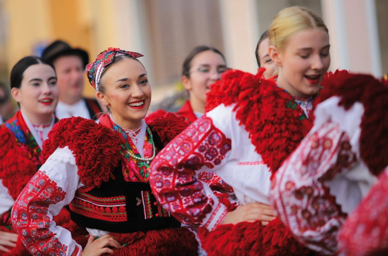
Mladost i ljepota ivanečkog veza u jednoj fotografiji.