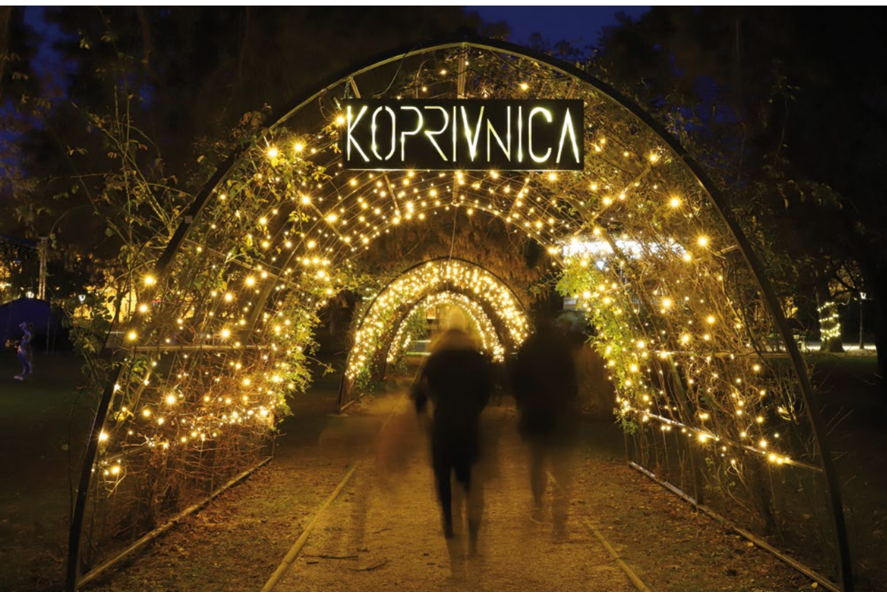
Blagdansko svjetlo u našem gradu.