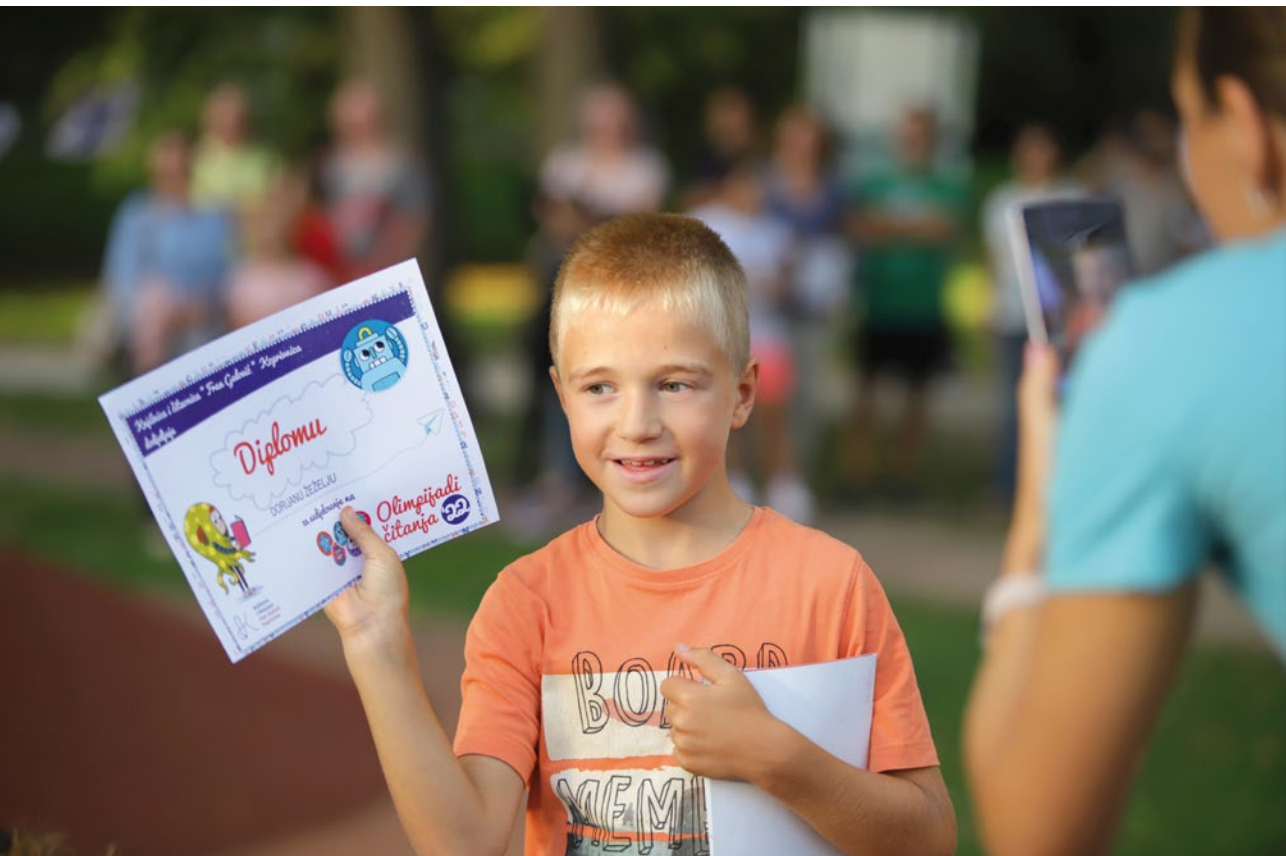
Na Olimpijadi se može sudjelovati i čitanjem.