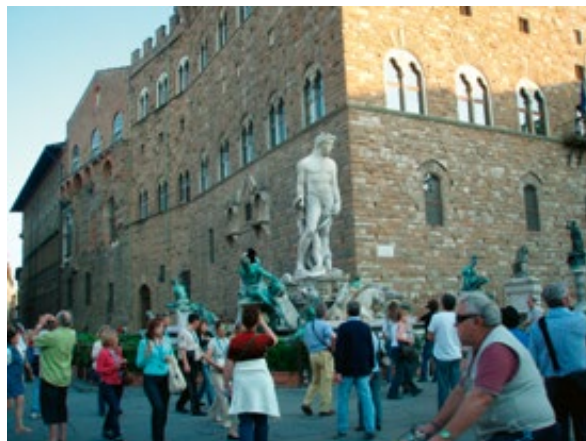
Slika 9: Neptunova fontana, Firenca