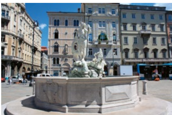
Slika 10: Neptunova fontana, Trst