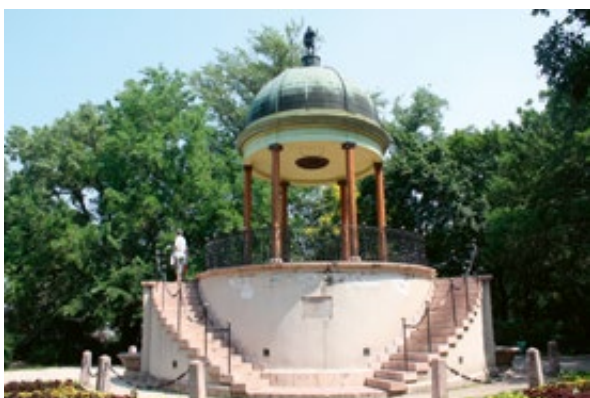
Slika 14: Neptunova fontana, Budimpešta