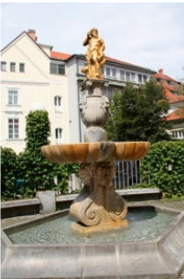
Slika 5: Neptunova fontana, Ljubljana