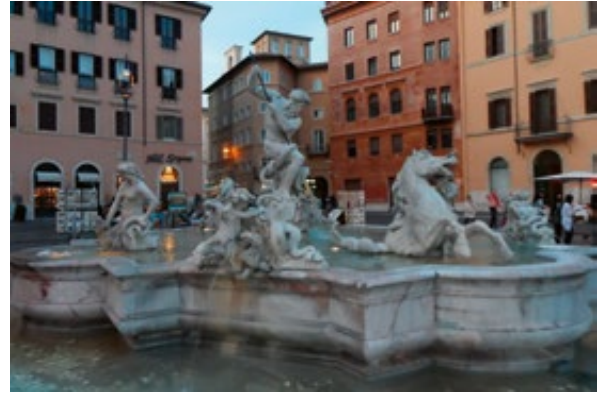
Slika 2: Neptunova fontana, Rim