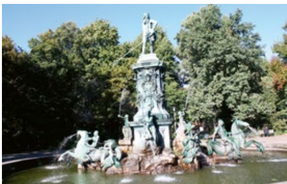
Slika 12: Neptunova fontana, Nürnberg