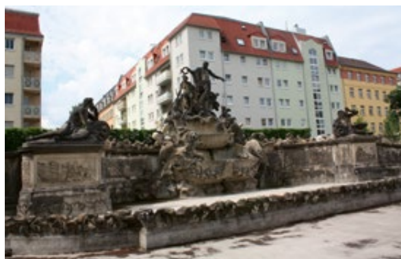
Slika 13: Neptunova fontana, Dresden