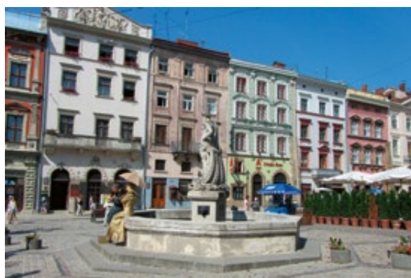
Slika 11: Neptunova fontana, Lviv