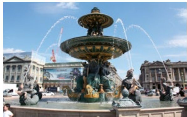
Slika 4: Jedna od fontana na Place Concorde, Pariz