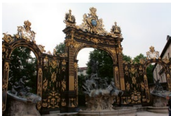
Slika 15: Neptunova fontana, Nancy