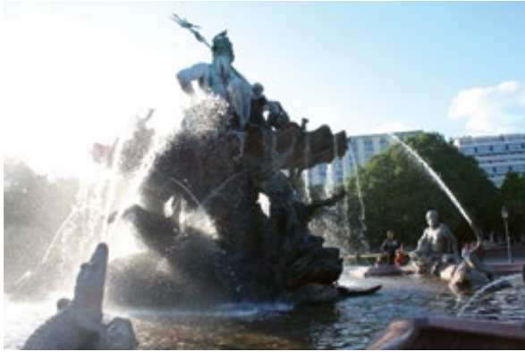
Slika 1: Neptunova fontana, Berlin