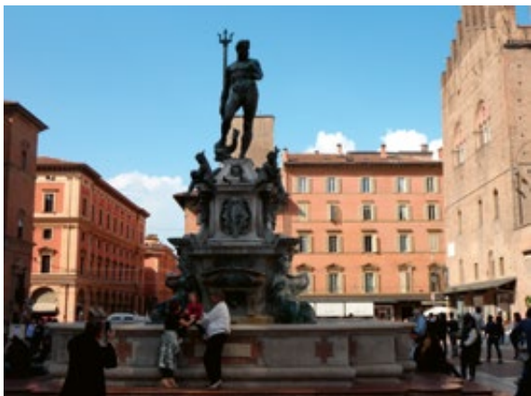
Slika 8: Neptunova fontana, Bolonja