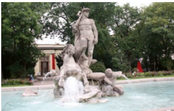
Slika 3: Neptunova fontana, München