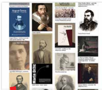
Virtualne izložbe kojima se može pristupiti s portala

Na portalu je najzastupljenija tekstualna građa sa 7005 zapisa, zatim slikovna građa sa 1628 zapisa, dok