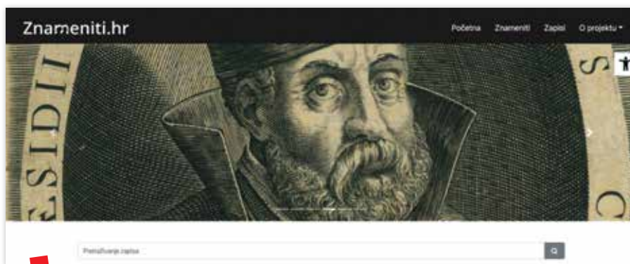
Portal Znameniti.hr – početna stranica

Osobe koje se predstavljaju na portalu odabrane su prema sljedećim kriterijima: znamenite ličnosti koje su djelovale u Hrvatskoj ili izvan nje, neovisno o porijeklu ili rođenju, odnosno ličnosti koje su svojim djelovanjem doprinijele prepoznavanju, definiranju i afirmaciji hrvatskog identiteta i čija su djela postala važna sastavnica hrvatske baštine; starije i ugledne ličnosti iz prošlosti; osobe koje u tekućoj godini imaju značajne obljetnice, te bez obzira na obljetnički karakter, osobe čija su djela digitalizirana u većem obimu i naposljetku da se osobita pozornost posveti uključivanju znamenitih žena.