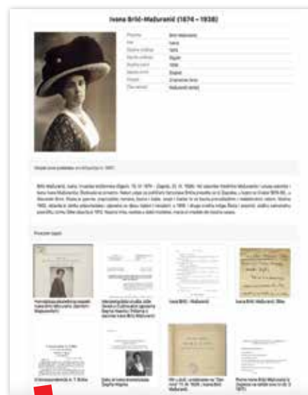
Zapis za Ivanu Brlić-Mažuranić

u kojem su nabrojani članovi dok se ispod zapisa nalazi grafički prikaz u vezama prema članovima (Slika 3).