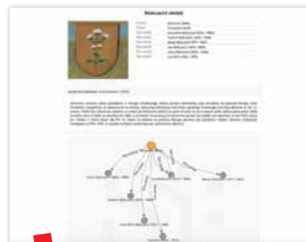
Prikaz obitelji Mažuranić na portalu Znameniti.hr