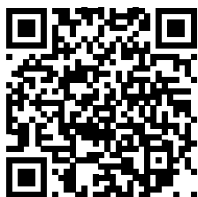
QR kod na poveznice Arheološkog muzeja Istre

Prilikom obnove zgrade i okoliša muzeja otkriveno je, uz antičke nalaze koji se uglavnom vežu uz Malo rimsko kazalište, histarsko naselje i dio već otprije poznatog histarskog groblja. Zbog važnosti i atraktivnosti teme, te opsežne video dokumentacije, odlučili smo se na prezentaciju arheoloških istraživanja histarskog naselja i nekropole u videu „Histri pod Arheološkim muzejem Istre“. Ovo iskustvo nam je pružilo priliku za sintezu prethodno stečenoga znanja, ali i proširivanje spektra mogućnosti za rad na video materijalu.