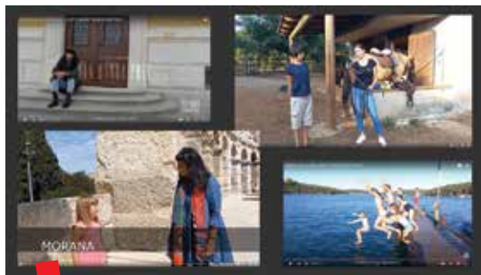
„Prilog uz glavno jelo“