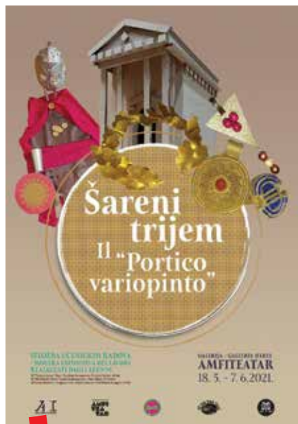
Plakat izložbe „Šareni trijem“

Uz osnovne društvene mreže AMI povremeno otvara dodatne kanale. Tako je uz izložbu „Histri u Istri“ 2013. godine otvorena istoimena Facebook stranica, YouTube kanal i mrežna stranica.