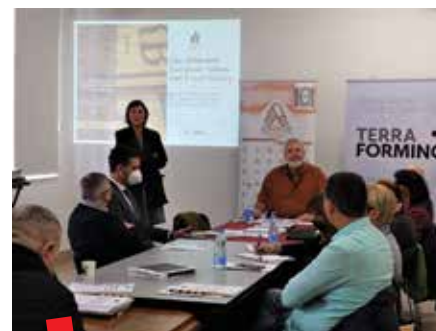
Međunarodni simpozij u Novom Sadu