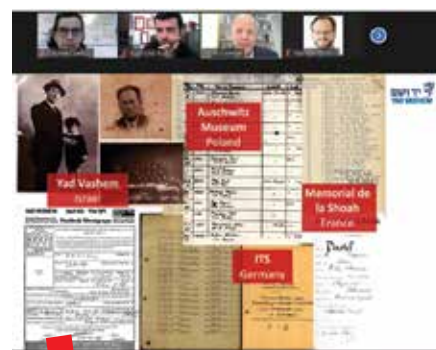
Stručni seminar za arhiviste