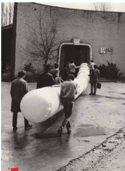
Otvorenje izložbe Gorkog Žuvele Niz; Galerija Studentskog centra, 1970.

koje prikazuju sam postav, te publiku, mahom studentske kolege izlagača kao i ostale posjetitelje. Fotografije su skenirane u rezoluciji od 600 dpi, te prema uputama koordinatora projekta, pohranjene na digitalnu participativnu platformu Topoteka.hr, koja će u svojstvu tematski objedinjene virtualne zbirke poslužiti za istraživanje, interpretiranje i kontekstualiziranje, predviđene za slijedeće projektne aktivnosti. U tom smoprocesu pratile jasno precizirane upute dobivene u popratnim priručnicima i Excel tablici normiranih pojmova. Uz normirane zadane metapodatke na hrvatskom i engleskom te opis događaja prikazanog na fotografiji, unijele smo i geopoziciju prostora, pri čemu smo se služile i Google maps aplikacijom. Kako je riječ o arhivskom materijalu Arhiva