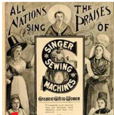
Reklama iz 1880. godine

Šivaća mašina Singer 1855. godine predstavljena je na 2. svjetskoj izložbi u Parizu. Mašina je osvojila prvu nagradu nakon čega su i otvorili prodajni ured u Parizu.