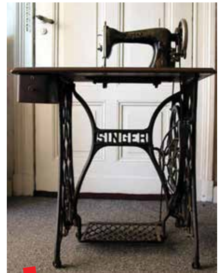
Klasična Singer mašina

Tijekom Prvoga svjetskog rata kompanija Singer je smanjila proizvodnju, a drugi zastoj u proizvodnji i prodaji bio je posljedica i Velike gospodarske krize.