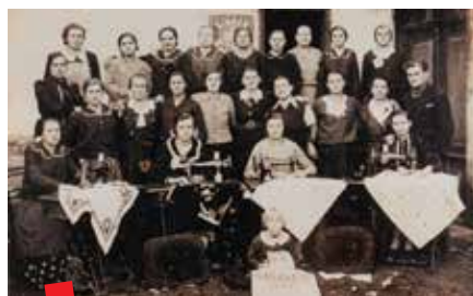
Polaznice tečaja krojenja, šivanja i vezenja u Donjem Kraljevcu 1937. godine

Fotografije na kojima su polaznice tečajeva u Donjem Kraljevcu bile su u vlasništvu Mare Štefok.