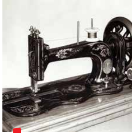
Godine 1865. Singer predstavlja novi model šivaće mašine.