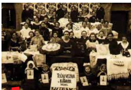
Polaznice tečaja veziva u Kotoribi 1926. godine

Prvi tečajevi na prostoru Kraljevine Jugoslavije, kao i na području Međimurja, bili su organizirani oko 1926. godine. Zapis o prvom tečaju u Međimurju je godina 1926. na fotografiji koja prikazuje polaznice tečaja s voditeljima u Kotoribi.