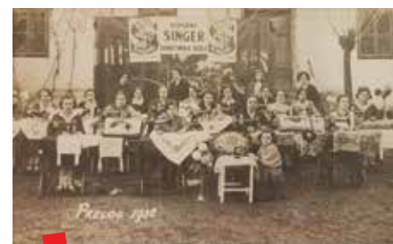
Polaznice tečaja, Prelog 1930. godina