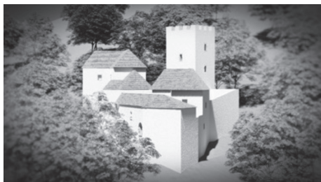
Slika 4. – Pretpostavljena 3D rekonstrukcija Kunšperka, pogled iz smjera sjevera (autori: Robert Iveković Misirača, Filip Koši)

što se ne može reći za ostale dijelove, gdje je unutar zidina narasla prava šuma. Stoga bi akcija čišćenja slična onoj na Cesargradu bila nužna za bolje poznavanje Kunšperka kao tvrdoga grada u cijelosti.