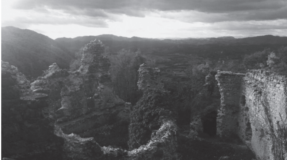
Slika 5. – Pogled na cesargradsko središnje dvorište, južno krilo palasa i kvadratnu kulu H s 1. kata, sadašnje stanje (fotografirao: Robert Iveković Misirača, rujna 2018.)

Iako rijeka Sutla u proučavanja povijesnog tijeka nije vojno „atraktivna“ poput Vojne krajine zbog mirne prirode granice, potrebno je napomenuti da je bila vrlo važna prije uspostave Vojne krajine 1578. godine, u kontekstu spomenutih akindžijskih provala 15. stoljeća. O ovim provalama izvještava Austrijska kronika Jakova (Jakob) Unresta.