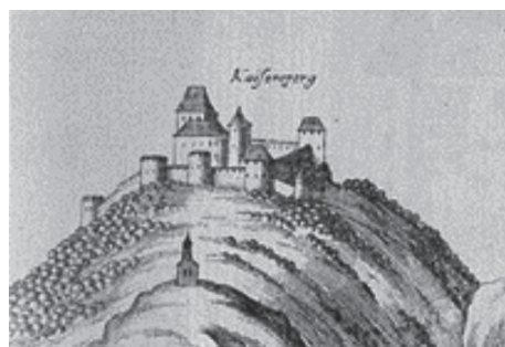
Slika 2. – Detalj koji prikazuje Cesargrad te crkvu Majke Božje Snježne; „Kunšperk“, Georg Matthäus Vischer, Topographia ducatus Styriae , Cankarjeva založba, Ljubljana, 1971., sl. 49

Cilj ovog članka 1 prikazati je, oslanjanjem na izvore i literaturu, povijesni razvoj granice na rijeci Sutli, razvoj Cesargrada i Kunšperka te koliko je fizička odvojenost rijekom Sutlom utjecala na njih i njihovu okolicu u razdoblju razvijenog i kasnog srednjeg te ranog novog vijeka, preciznije od 12. do početka 17. stoljeća. Istraživanje ove teme temelji se ponajprije na dostupnim pisanim izvorima koji se odnose na oba tvrda grada i istoimene posjede, dok historijska topografija, koja se koristila u svrhu rekonstruiranja povijesnog izgleda prostora, ukazuje na stratešku važnost cjelokupnog prostora.