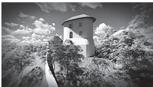
Slika 3. – Pretpostavljena 3D rekonstrukcija Cesargrada, pogled s istoka (autori: Robert Iveković Misirača, Filip Koši)

Prvi spomen Cesargrada veže se uz datum 27. veljače 1399. godinu, vladara Zemalja Krune sv. Stjepana Žigmunda Luksemburškog i Hermana II. Celjskog, a sama povelja nastala je ... u godini dvanaestoj naše vladavine. ... 21 Mjesto njena nastanka nije naznačeno, što ostavlja prostor za različita tumačenja. Moguće je da je darovnica nastala u Varaždinu, gradu koji su Celjski dobili od Žigmunda dvije godine prije objavljivanja navedene darovnice, 22 a koji je po ustanovljenju Zagorske grofovije i njenog prijelaza u ruke grofova Celjskih postao sudsko i administrativno sjedište. 23 Iz dokumenta vidljivo je da je Žigmund Hermanu