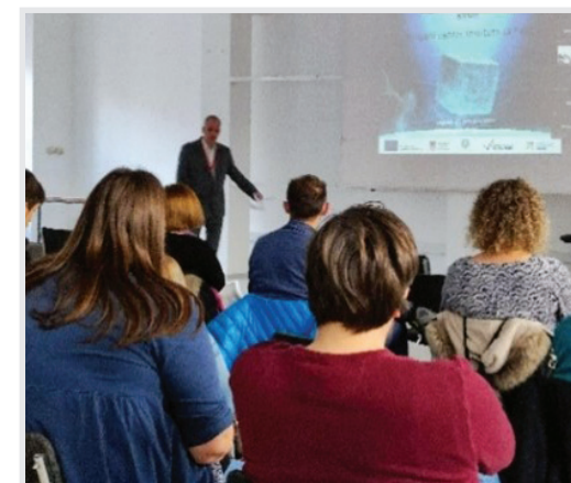
... konferencija povodom završetka projekta kriogenog postrojenja IF-a