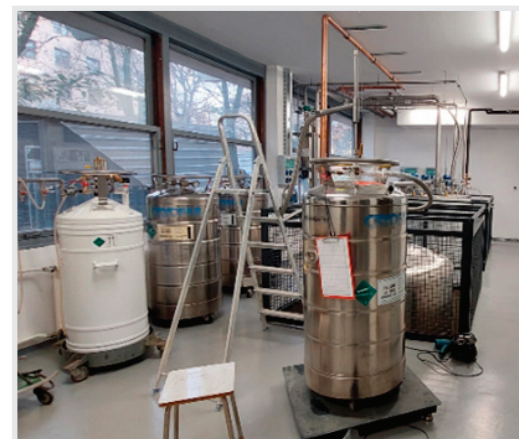
... centralni dio kriogenog postrojenja