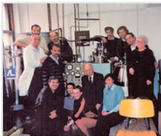
... posljednje ukapljivanje na prvom ukapljivaču ljeti 1989.