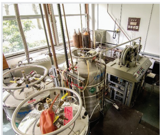
... novi, drugi po redu ukapljivač helija većeg kapaciteta instaliran 1991.