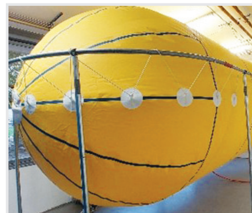
... balon za prikupljanje plinovitog helija