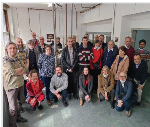
... posljednje ukapljivanje na drugom ukapljivaču 13. ožujka 2022.