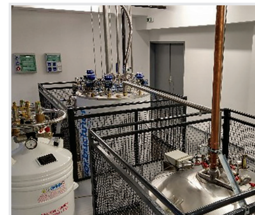
... novi, treći po redu ukapljivač helija