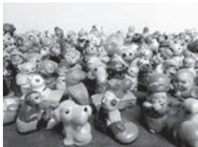
Donacija šiljila Jasne Radulović

Zbirka čuva oko 300 pisanki, nekoliko školskih ploča, audiovizualne materijale za rad, dijafilmove, element filmove, pomagala za nastavu fizike i kemije, fotografije koje su se koristile na nastavi iz mnogih predmeta, vježbenice, slovarice i slično. Zbirka je heterogena, a više od 5000 muzejskih predmeta koji se nalaze u njoj datiraju od kraja 17. stoljeća do danas i pružaju uvid u različite oblike didaktičke transformacije, materijale, tehnike izrade i funkciju u nastavnom procesu. Najveći dio građe s kraja je 19. i iz prve polovine 20. stoljeća.