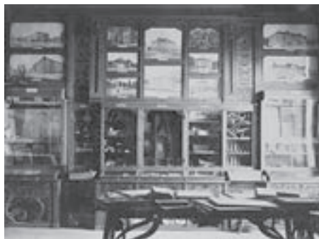
Zbirke Hrvatskoga školskog muzeja, Zagreb, oko 1900. (HŠM Mf 371)