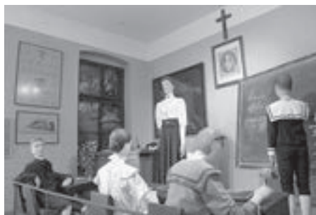
Izgled školske učionice potkraj 19. stoljeća

Upravo se preko te prve cjeline mogla ispričati čitava priča našega stalnog postava. Zato će ta soba biti središnja točka pomoću koje će se dobiti bolji uvid u strukturu i sadržaj Zbirke nastavnih sredstava i pomagala.