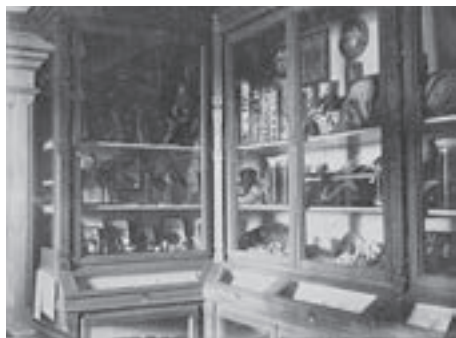
Zbirke Hrvatskoga školskog muzeja, Zagreb, oko 1900. (HŠM Mf 360)

Hrvatski školski muzej otvoren je 19. kolovoza 1901. u povodu proslave 30. godišnjice postojanja HPKZ-a. Građa prvoga stalnog postava Muzeja bila je dio prvih muzejskih zbirki: Zbirke nastavnih sredstava i školske opreme, Pedagoške knjižnice te