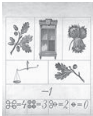
HŠM Mp 5766