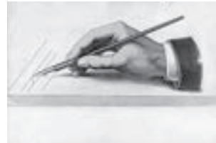
HŠM Mp 5951

Ovdje je riječ o “Zidnoj početnici za hrvatski jezik” Stjepana Basaričeka 7 iz 1892. godine (HŠM Mp 5954). Ta vrsta zidne table nazivala se i početnica za stienu , a na njima je bio otisnut sadržaj jednak onom u knjigama početnicama. Na tabli se uz slovo abecede nalazio i slikovni prikaz povezan s pojedinim slovom, koji bi djetetu pomagao u procesu učenja početnoga čitanja i pisanja. Druga zidna tabla jest kolorirana litografija koja se koristila na nastavi matematike. “Uči nas kako se oduzima s brojem jedan”, odgovarali su posjetitelji na pitanje čemu je služila dok su promatrali slikovne prikaze brojeva, ormara, žira i vage. Radi se o muzejskom predmetu iz Praga s kraja 19. stoljeća koji nosi inventarnu oznaku HŠM Mp 5766 naziva “Predložak za početno računanje”.