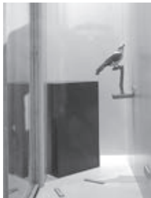
Zlatna vuga u stalnom postavu nakon potresa

Nažalost, građa je nakon potresa pospremljena po čuvaonicama. Postav se polako prazni, čak je na sigurnom i veliki orao štekavac (HŠM Mp 214). “Najhrabriji” se pokazao maleni mužjak zlatne vuge (HŠM Mp 190), koji i dalje prkosi ovim teškim vremenima.