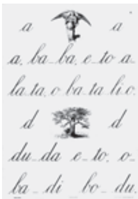
HŠM Mp 5954