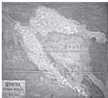
HŠM Mp 6134

U Zbirci nastavnih sredstava i pomagala čuva se oko 250 zemljovida. Reljefni zemljovid Hrvatske, Slavonije i Dalmacije koji se nalazi na zidu učionice stalnoga postava nastao je u Zagrebu 1886. godine (HŠM Mp 6134), a izradio ga je Josip Kirin. 9 Posjetiteljima je zorno pokazivao granice Hrvatske iz vremena Austro-Ugarske Monarhije te je svjedočio o vremenu u kojem je učionica kao takva postojala.