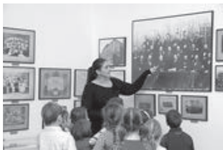
Stručna vodstva po stalnom postavu Hrvatskoga školskog muzeja

Na početku stalnoga postava otvorenog na Svjetski dan učitelja 5. listopada 2000. nalazila se cjelina nazvana Izgled školske učionice potkraj 19. stoljeća . Bilo da su ispred mene bila djeca, učenici ili odrasli, uvijek bih od njih zatražila isto: da zatvore oči i prisjete se učionice u kojoj su provodili vrijeme u prvim danima osnovnoškolskoga obrazovanja. Posjetitelj bi se u mislima vratio u svoju školsku klupu, na njoj bi pronašao svoj školski pribor, školsku torbu, zatim bismo u raznim kutcima učionice zajedno pronašli raznovrsna učila, na zidovima učeničke radove, razgovarali bismo o učiteljicama i učiteljima, ali i o učenicima, odjeći, obući, zadacima, ocjenama, izostancima, školskim praznicima. Nakon toga uvoda ušli bismo u prvu cjelinu, u staru učionicu, gdje bismo dobili dobar dojam koliko se škola s kraja 19. stoljeća razlikovala od ove današnjega vremena.