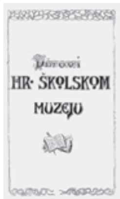
Darovi Hrvatskom školskom muzeju

Podatke o tome da se velika količina građe Zbirke radova prikupila u prvim godinama postojanja Muzeja pronalazimo u popisima donirane građe u prvom katalogu Muzeja (Medved, 1901) te izdanju Darovi Hrvatskom školskom muzeju . U Darovima preko kratkih izvještaja pratimo kako su se prikupljala sredstva i građa od 12. listopada 1900. do kraja 1911. godine. U tu svrhu organizirane su zabave u korist Školskoga muzeja te prigodni koncerti, druženja, ples, tombola. Takva događanja bila su česta u školama diljem Hrvatske toga vremena.