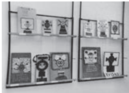
Izložba Kviskoteka u HŠM-u , 1991.

Izložbenom djelatnošću, likovnim natječajima i brojnim marketinškim akcijama povećavao se muzejski fondus.