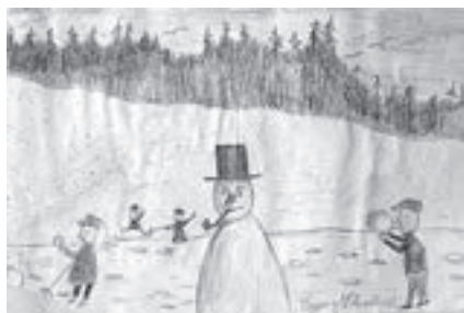
Crtež, Eugen Erlich, Kraljevska vježbaonica učiteljske škole, Zagreb, 1921. (HŠM Mp 5538/7)

Djeca crtaju (Ružić, 1959). Josip Roca 11 bio je čest suradnik i prijatelj Muzeja, a danas u čuvaonicama čuvamo mnoštvo radova na koje je svojim velikim znanjem utjecao ili čiji je autor.