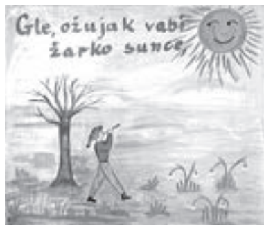
Crtež Mjeseci u godini – Ožujak, Viktorija Potočnjak, Zagreb, 1956./1957. (HŠM 31788)

Zbirka će nastaviti pratiti trendove. Prikupljat će se radovi koji svojim sadržajem svjedoče o vremenu u kojem su nastali. Nadamo se da će Muzej ponovno započeti i s izložbenom djelatnošću u vlastitim prostorima, da će ponovno biti domaćin izložbama odgojno-obrazovnih ustanova iz cijele Hrvatske. Upravo su to trenuci u kojima se uspostavlja najčvršća poveznica muzeja i publike, a za Zbirku radova učenika i nastavnika to podrazumijeva i jamči poveznicu Zbirke i njezinih stvaratelja.