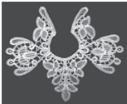
Ogrlica od čipke (HŠM Mp 169)

Na prostoru Hrvatske za početak i razvoj obrazovanja u ženskom ručnom radu važnost imaju crkveni redovi, a ono se posebice razvija nakon dolaska milosrdnica u Zagreb sredinom 19. stoljeća. U isto vrijeme osnivaju se i brojne svjetovne obrtne, učiteljske i stručne škole za žene. U Školski muzej godinama su pristizali i pristizu primjerci koji pokazuju kakvo se bogatstvo stvaralo na tom nastavnom predmetu. Unutar Zbirke čuva se nekoliko predmeta nastalih u Samostanskoj školi u Zagrebu tijekom 70-ih godina 18. stoljeća, primjerice uzornici uzlanja (HŠM Mp 174) i uzornik mreškanja (HŠM Mp 173). U čuvaonicama se brinemo i o brojnim uzornicima veza, pletenja, čipke s kraja 19. stoljeća, ukrasnim mapama za pisma, a unutar stalnoga postava nalazila se i ogrlica od čipke, rad učenice iz Kraljevske zemaljske ženske stručne škole u Zagrebu (HŠM Mp 169), kao i prekrasan umjetnički rad koji prikazuje kale slikan iglom (HŠM Mp 152).