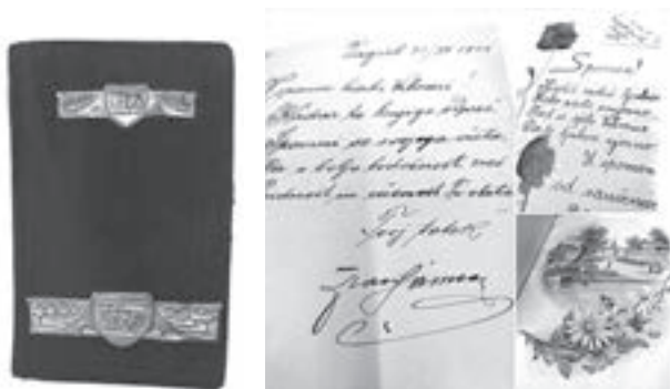
Spomenar Vilme Samsa (HŠM 43075)

iz Slovenije. Spomenar ima korice od plavoga baršuna i 46 listova. Prepun je crteža, suhoga lišća, pjesmica, lijepih tekstova ispisanih rukom. Spomenar je dar Anđelke Stipčević iz 2018. godine (HŠM 43075).