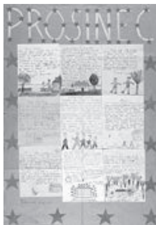
Zidne novine, Dežanovec, 1948. (HŠM 31792)