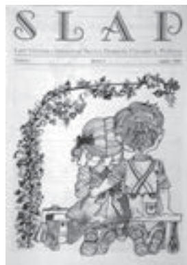
Slap . Požega, 1995.