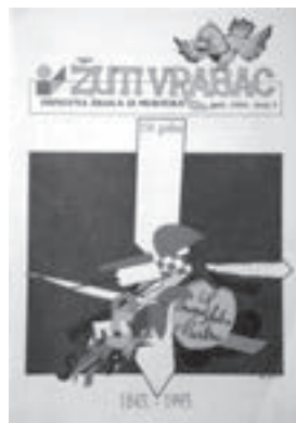
Žuti vrabac . Murter, 1995.

Dakako, osim školskih listova u Zbirci se čuvaju i razredni časopisi, časopisi vrtića i glasila/bilteni nekadašnjih omladinskih radnih akcija. Svaki od tih listova, neovisno o tome čuvamo li ga fragmentarno ili cjelovitije, svjedok je vremena u kojem je nastao, društvenoga trenutka, organizacije škole, odnosa s lokalnom zajednicom. Svaki list svjedoči o interesima učenika koji ga stvaraju i temama koje u nekom trenutku postaju važne (primjerice ekologija, održivi razvoj i sl.), ali i o trudu učenika i njihovih učitelja i ravnatelja da u školskom listu dokumentiraju prošlost i sadašnjost svoje škole, radove