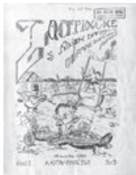
Tratinčice s naših livada ubrane dječjom rukom među starijim su listovima koji se čuvaju u Zbirci. Kastav, 1933.

Učenički i školski listovi izvrstan su medij za predstavljanje aktivnosti same škole (ili razreda) iz vizure učenika (pod vodstvom mentora). Njima se predstavljaju literarni, likovni i novinarski uradci učenika i prikazuju događanja unutar škole, ona koja škole organiziraju ili u kojima škola sudjeluje. Iz njih se izvrsno daju iščitati pogledi i stavovi učenika o pojedinim aktualnim temama ili mikrotemama (onome što se događa ili planira u njihovoj školi ili zajednici).