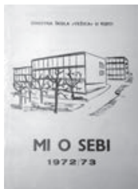
Mi o sebi . Rijeka, 1973.