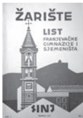
Žarište . Sinj, 1973.