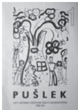
Pušlek . Bedekovčina, 1994.

ekstrakurikularni angažman i odraz su sklonosti učenika autora, urednika i učitelja koji im u tome pomažu. Mnogi listovi imaju pak tradiciju izlaženja neovisno o tome jesu li mijenjali nazive. Jordanovački vjesnik , od 1962. godine Naš Jordanovac , možemo pratiti u Zbirci od 1957. pa sve do 2007.; ne čuvamo sve izašle brojeve, no ukupno ih je 64. Ovaj je list zanimljiv kao i sama škola, koja je bila jedna od tzv. eksperimentalnih škola 4 (postala je to 1960.), a ima primjerice i školsku zadrugu.