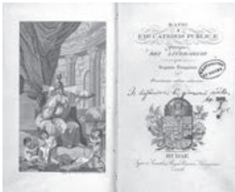
Opći školski i obrazovni sustav za Ugarsko Kraljevstvo i njemu pridružene zemlje. Budim, 1806. (HŠM K1 2855)

Prvi školski zakon donesen u Hrvatskom saboru – Zakon od 14. listopada 1874. ob ustroju pučkih školah i preparandijah za pučko učiteljstvo u kraljevinah Hrvatskoj