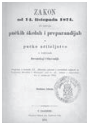
Službeno izdanje prvoga hrvatskog školskog zakona, tzv. Mažuranićeva zakona. Zagreb, 1874. (HŠM 37465)