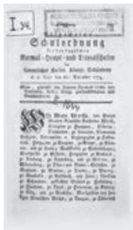
Opći školski red za njemačke normalne, glavne i trivijalne škole u svim c. k. nasljednim zemljama. Beč, 1774. (HŠM K2 1644)