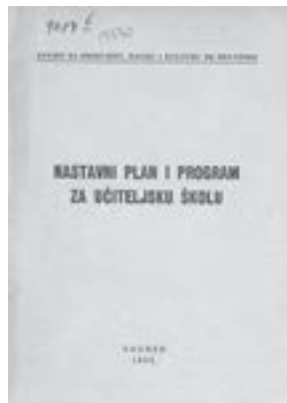
Nastavni plan i program za petogodišnje učiteljske škole. Zagreb, 1952. (HŠM 38005)

i Slavoniji – zastupljen je u Zbirci u više primjeraka i izdanja. Zakon je regulirao osnovno školstvo i obrazovanje učitelja i označio početak snažnijega procesa sekularizacije, demokratizacije i modernizacije hrvatskoga školstva. Propisao je jedinstvenu, obaveznu opću pučku školu za svu djecu, sankcije za sve koji priječe polazak djece u školu, stručni nadzor nad školama, bolje učiteljsko obrazovanje i izjednačavanje plaća učiteljica i učitelja. Naknadnim uredbama propisani su školski i nastavni red, ustrojni statut za preparandije, uprava pučkih škola, nastavni plan i program te propisi o namještanju učiteljskoga osoblja, polaska škole, o ispitima za učiteljsku službu u građanskim školama i opetovničkoj nastavi. 4