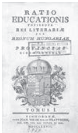
Opći školski i obrazovni sustav za Ugarsko Kraljevstvo i njemu pridružene zemlje. Beč, 1777. (HŠM K1 2918)

upravnih tijela, nastavne planove i programe te disciplinarne propise za osnovne i srednje škole, statute i pravila rada prosvjetnih ustanova i društava. Najviše se jedinica odnosi na hrvatsko školstvo, a Zbirka obuhvaća i publikacije na njemačkom, češkom, ruskom, srpskom, francuskom i latinskom jeziku. Sve jedinice građe upisane su u jedinstvenu inventarnu knjigu Hrvatskoga školskog muzeja i obrađene u računalnom programu K++, pri čemu je svaka jedinica dokumentirana jednom ili dvjema fotografijama – prednjih korica i/ili naslovne stranice. Fotodokumentacija Zbirke ima ukupno 1468 fotografija. Građa je zaštićena i