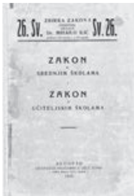
Zakonima o srednjim i učiteljskim školama regulirano je srednje školstvo u Kraljevini Jugoslaviji. Beograd, 1930. (HŠM 36956)