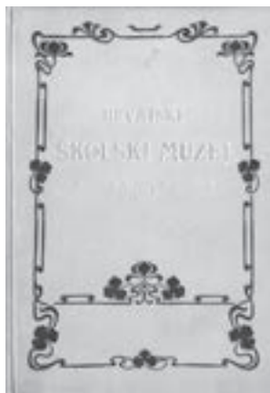
Naslovnica prvoga kataloga Hrvatskoga školskog muzeja iz 1902.