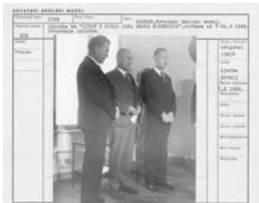
Fotografija s otvorenja izložbe Život i djelo Jana Amosa Komenskog održane u Hrvatskome školskom muzeju 1968.

12. Fototeka Hrvatskoga školskog muzeja sadržava fotografije vezane primarno uz izložbe, posebna događanja i pedagošku djelatnost Muzeja. Muzej ima ustrojenu Zbirku fotografija, no ona je usmjerena na fotografije koje se odnose na školstvo, odgoj i obrazovanje općenito, a Fototeka je primarno usmjerena na Hrvatski školski muzej i njegove aktivnosti.