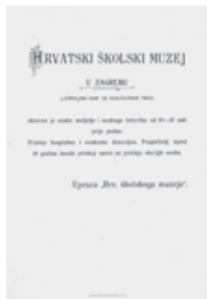
Prva tiskana obavijest o radnom vremenu Hrvatskoga školskog muzeja iz 1901.

Od 90-ih godina u Muzeju se organizira najmanje jedno posebno događanje godišnje, a znatnije povećanje bilježi se ulaskom u 21. stoljeće. Naime, od tada se na godišnjoj razini održe u prosjeku barem tri posebna događanja. Gledajući s medijske