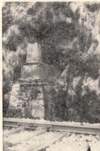
Slika 4 ilustruje današnje stanje fundamentalnog repera »Ruše«.

Bilo bi svakako preporučljivo, da se postojeći fundamentalni reper prilikom obnove i dopune nivelmana visoke tačnosti uključi u tu mrežu, jer bi to bilo bez sumnje u interesu praćenja nastalih promena.