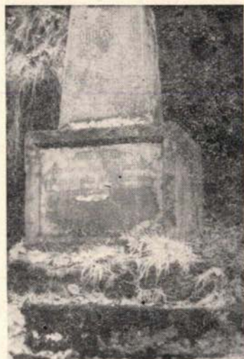
Slika 3 sa uočljivim citiranim napisima na reperu »Ruše«

Marka »M« — polirana površina pod monumentom ima kotu 295,5957 (podatak iz »Nivellements-ergebnisband 1 iz godine 1899, »Urmarke No. 374«) a kota uništenog pomoćnog repera bila je 259,4821 nad Jadranskim morem.