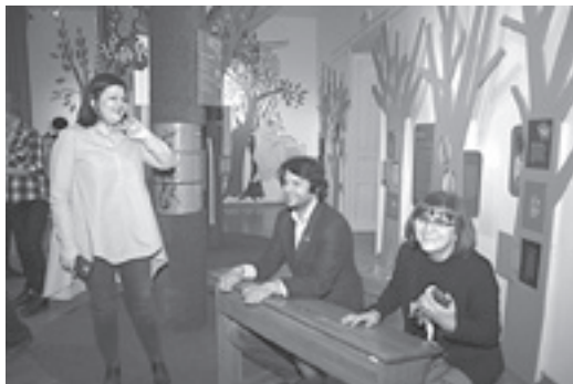
Noć knjige u Hrvatskom školskom muzeju Kako smo (pre)živjeli školu , 21. travnja 2017.

Što sam želio biti kad odrastem naziv je ciklusa susreta učenika s poznatim osobama iz javnoga života – likovnim umjetnicima, književnicima, glazbenicima i sportašima, koji je organizirao Hrvatski školski muzej počevši sa 2006. godinom. Za prvi takav susret, pred božićne blagdane, Muzeju je u goste došao poznati hrvatski nogometaš Zvonimir Boban sa suprugom Leonardom.