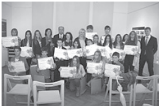
Lidice 2014. - dodjela nagrada u HŠM-u 19. studenog 2014.