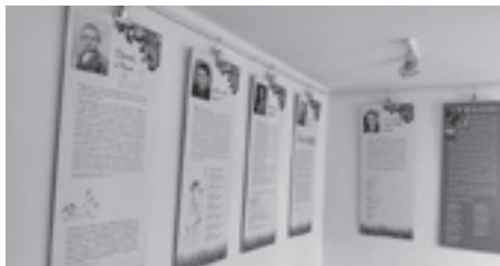
Kad bi drveće hodalo , Knjižnica Savski gaj

Osim brojnih gostovanja pokretnih izložaba Hrvatskoga školskog muzeja diljem Hrvatske, zahvaljujući dugogodišnjoj suradnji i prijateljstvu sa Slovenskim šolskim muzejom naša pokretna izložba Bertuchovo slikovno carstvo – Otkrij tajne dječje enciklopedije gostuje od studenoga 2021. do kolovoza 2022. u Ljubljani u Slovenskom šolskom muzeju.