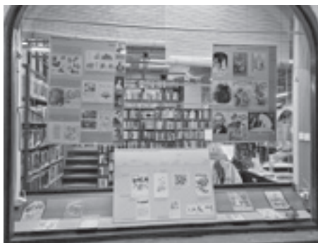
Od slikovnjaka do Vragobe : hrvatske slikovnice do 1945. , Knjižnica Medveščak