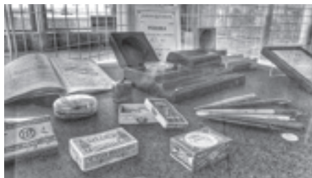
Krasopis – lijepo pismo , fotografije s postavljanja izložbe u NSK