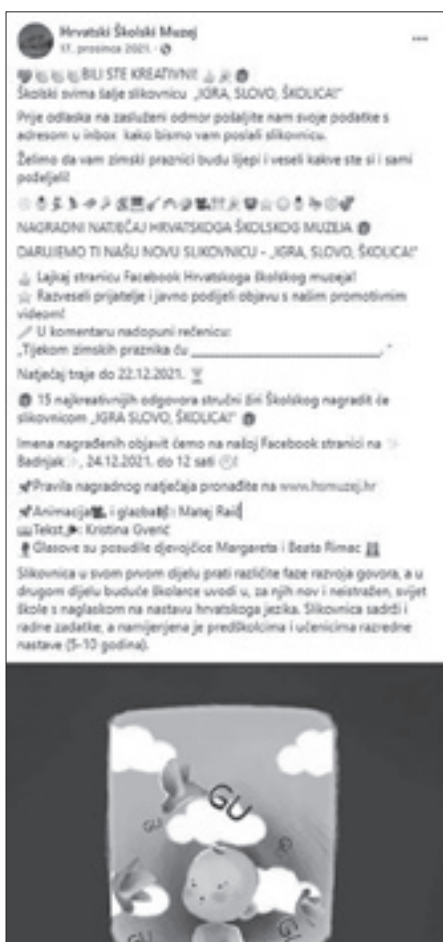
Nagradni natječaj – IGRA SLOVO ŠKOLICA!