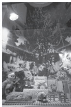
Igre i šale za naše male – fotografije s otvorenja u Etnografskom muzeju