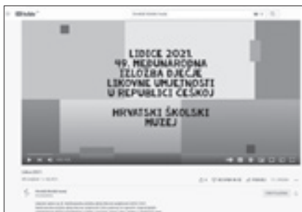
Lidice , YouTube stranica HŠM-a