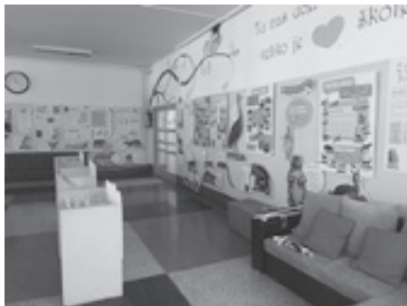
Fotografije s postavljanja izložbe Bertuchovo slikovno carstvo , OŠ Cvjetno naselje

Tijekom 2021. pokretne izložbe Hrvatskoga školskog muzeja gostovale su diljem Hrvatske, ali i izvan granica Lijepe Naše.