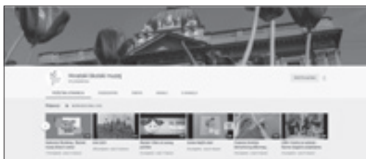
YouTube stranica HŠM-a

S obzirom na nepovoljnu epidemiološku situaciju zbog pandemije Covida-19 i nemogućnosti održavanja pedagoškoga programa u vlastitom prostoru, Hrvatski školski muzej najveći dio svojega pedagoškoga programa prezentirao je javnosti online , preko našega YouTube kanala 4 i Facebook stranice 5 .