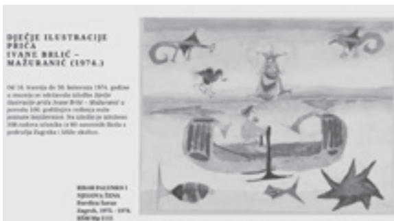
Šarenilom boja sakrivamo pukotine

Godinama je Hrvatski školski muzej bio domaćin izložbe školskih listova osnovnih i srednjih škola grada Zagreba – LiDraNo , no 2021. školski listovi prvi su put predstavljani virtualno.