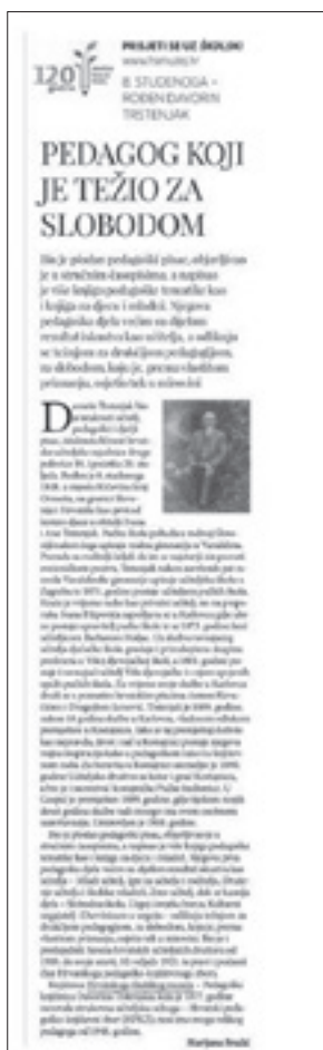
Prisjeti se uz Školski

Ovim putem želimo zahvaliti svim muzejima, kulturnim ustanovama i školama koji su nam omogućili da tijekom 2021. upoznajemo javnost s kulturnom baštinom pohranjenom u našem muzeju. Veliko hvala: Etnografskom muzeju iz Zagreba, Muzeju suvremene umjetnosti, Galeriji Klovićevi dvori, Muzeju grada Zagreba, Nacionalnoj i sveučilišnoj knjižnici u Zagrebu, svim osnovnim i srednjim školama i knjižnicama koje su ugostile naše izložbe i muzejske radionice.