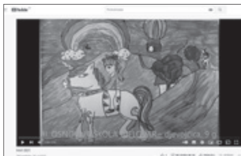
KAO 2021.