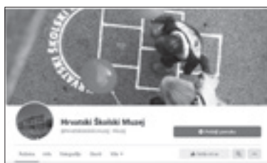
Facebook stranica HŠM-a