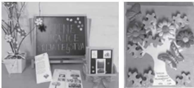
Šarene slagalice prijateljstva, Zoom radionica HŠM-a i Centra za autizam

S Centrom za autizam iz Zagreba nastavljena je višegodišnja međuinstitucijska suradnja povodom obilježavanja Dana svjesnosti o autizmu. Zajednička radionica Hrvatskoga školskog muzeja i Centra za autizam održala se 14. travnja preko Zooma.