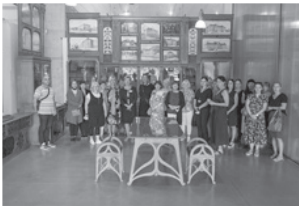
Otvorenje Pariške sobe u Muzeju suvremene umjetnosti

Hrvatski školski muzej 25 godina sudjeluje u Edukativnoj muzejskoj akciji (EMA), koju organizira Sekcija za muzejsku pedagogiju i kulturnu akciju Hrvatskoga muzejskog društva. Tako se i 2021. na Međunarodni dan muzeja, 18. svibnja, HŠM u online programu predstavio Izvanrednom izložbom! Izložbom su u više priča prikazani predmeti, radovi učenika i nastavnika koji su publici predstavili zaboravljene priče učeničkoga stvaralaštva čuvane tijekom 120 godina povijesti HŠM-a.