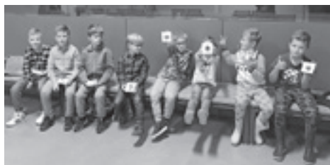
Quillajmo s Kožarićem – radionica Hrvatskog školskog muzeja u Muzeju suvremene umjetnosti

Obilježili smo i Europski tjedan mobilnosti (16. – 22. rujna; Krećimo se zdravo! ). Tom prigodom u Osnovnoj školi Ivana Gundulića i Osnovnoj školi Šestine održane su muzejske radionice Hrvatskoga školskog muzeja Kako se nekada jačalo u školama .