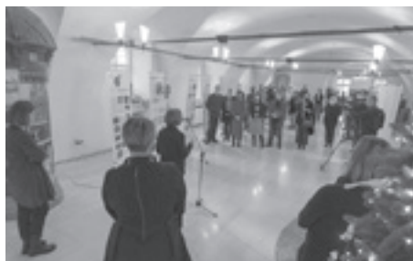
Biseri Školskog muzeja – fotografije s otvorenja izložbe u Muzeju grada Zagreba

Posljednja izložba koju je Hrvatski školski muzej organizirao u slavljeničkoj 2021. bila je Krasopis – lijepo pismo . Izložba je otvorena u Nacionalnoj i sveučilišnoj knjižnici u Zagrebu. Preko 300 originalnih predmeta predstavljenih javnosti dokaz su koliko je važan bio i što je za povijest hrvatskoga školstva značio nastavni predmet Krasopis .