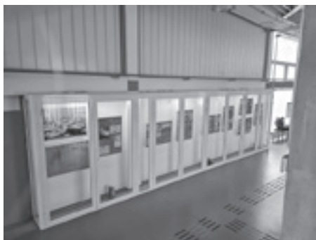
Fotografija s postavljanja izložbe Strukovno školstvo u Hrvatskoj , Strukovna škola Sisak

I ove godine nastavila se suradnja Hrvatskoga školskog muzeja i Centra za autizam iz Zagreba koja traje od 2016. godine. Povodom obilježavanja Svjetskoga dana svijesti o autizmu pokretna izložba Bertuchovo slikovno carstvo – Otkrij tajne dječje enciklopedije gostovala je u Centru uz popratni radionički program.