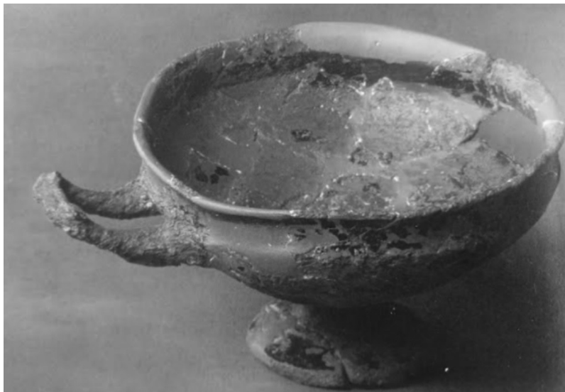
Slika 1. Oponašani kilik iz Kapiteljske njive (5. st. pr. Kr.) Nalazište: Kapiteljska njiva, grob VII, 20

To posebno valja naglasiti za period nakon utemeljenja naseobina pa do rimske prevlasti koji je kardinalan, jer su okolnosti tada prvi put udarile temelje aktivnijem društvenom isprepletanju urođenika s Grcima.