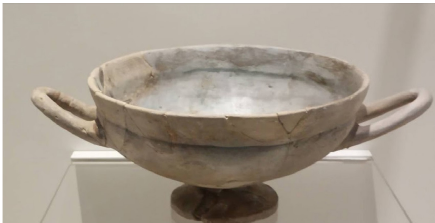
Slika 2. Sivi monokromni kilik, lokalna imitacija (6. st. pr. Kr.) Nalazište: Marseilles