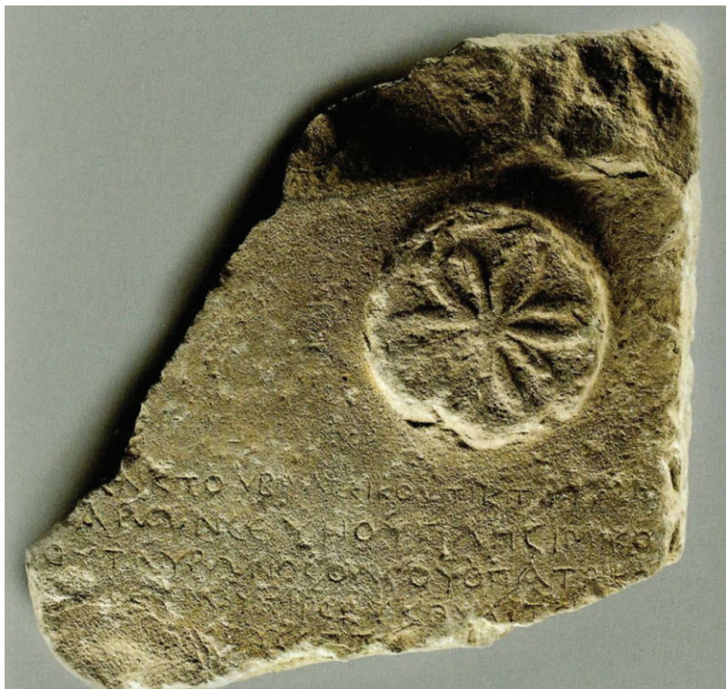
Slika 3. Ulomak spomenika s grčkim natpisom (tzv. „Keunov“ natpis) Nalazište: Bribirska glavica Preuzeto iz KUNTIĆ-MAKVIĆ I MAROHNIC 2010: 89, kat. 420.