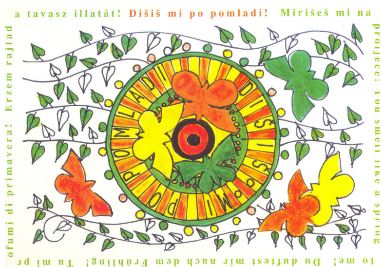
Slika 1. Felixova kartica : Mirišeš mi na proljeće

Aktivnosti svake godine započinju početkom školske godine i to raspisivanjem tematskog literarno-likovnog natječaja. Nastavljaju se u studenom, u mjesecu borbe protiv ovisnosti, tematskim satovima, potpisivanjem svečane prisege o nepušenju i malim kvizom. Tijekom školske godine učenici pod vodstvom mentora provode aktivnosti definirane natjecanjem i svečanom prisegom. Sve aktivnosti programa privedu se kraju u mjesecu svibnju, na završnoj regionalnoj priredbi pod nazivom „ Mirišeš mi na proljeće “. U sklopu priredbe održi se i izložba literarnih/likovnih radova učenika.