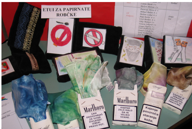
Slika 3. Radovi s natjecanja pod naslovom »Majica s porukom« i »Modni dodatak«