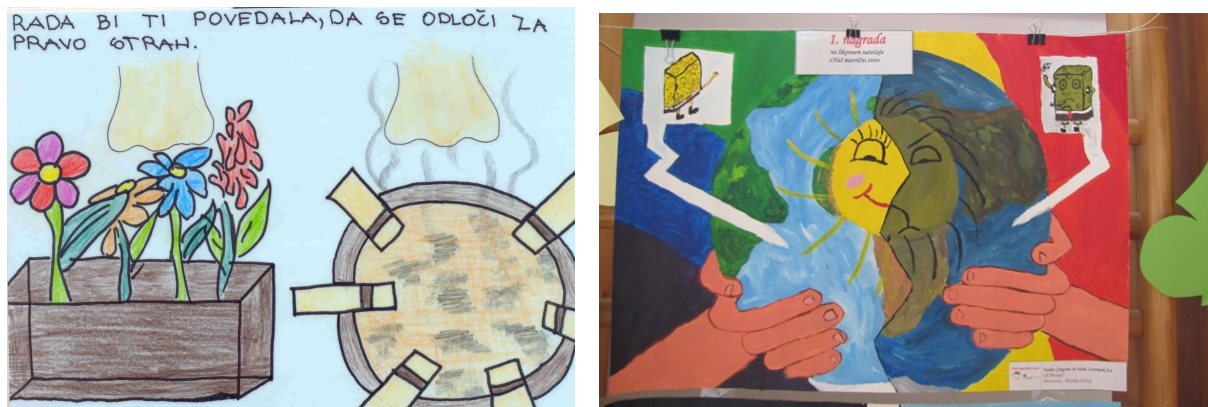
Slika 2. Radovi s natjecanja pod naslovom: »Rado bih ti rekao/la...« i »Naš šareni svijet«

Aktivnosti su se odvijale u okviru školskih predmeta, a vodili su ih pedagozi iz likovnog odnosno literarnog područja, dok je natjecanje bilo koordinirano od strane stručnjaka našeg zavoda. Kompletna organizacija obuhvaćala je raspisivanje natječaja, stručno savjetovanje, operativno vođenje i zaprimanje radova. Natjecanje uvijek završava u sklopu završne regionalne priredbe podjelom nagrada i priznanja te izložbom svih radova.