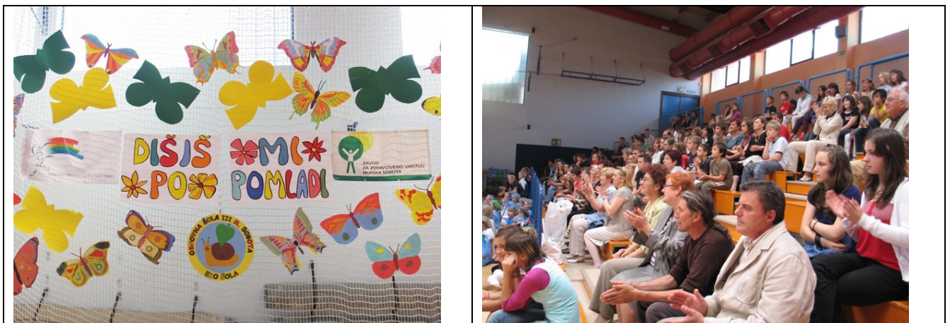
Slika 4. Pozornica i sudionici priredbe „ Mirišeš mi na proljeće “

Završna regionalna priredba » Mirišeš mi na proljeće « organizira se tradicionalno već više od deset godina. Uvijek se odvija na Svjetski dan nepušenja u odabranoj pomurskoj osnovnoj školi. Važnu ulogu u realizaciji priredbe imaju gostujuća osnovna škola i voditelj programa iz Zavoda za javno zdravstvo Murske Sobotice. Program priredbe timski se osmišljava: napravi se plan izvođenja programa i postavljanja izložbe. Pritom se posebna pažnja pridaje scenografiji, vođenju priredbe i kulturnom sadržaju programa. Izložba učeničkih radova dio je jednostavno ukrašene pozornice koja iz godine u godinu zadržava prepoznatljivu idejnu nit. Na priredbi su dobrodošli svi učenici koji su sudjelovali u programu, njihovi mentori, predstavnici nevladinih organizacija, Zavoda za školstvo Republike Slovenije, Saveza slovenskih udruženja za borbu protiv raka, lokalnih zajednica i medija. Izložba se postavlja dan prije same priredbe na kojoj se na inovativan način predstavlja tematika izložbe. Priredba započinje kulturnim programom i predstavljanjem gostujuće škole te se nastavlja podjelom priznanja, pohvalnica i nagrada. Nakon priredbe sudionici mogu u ugodnoj atmosferi pogledati izložbu. Učenici tada mogu naći svoje vlastite radove, no istovremeno vidjeti i radove s porukama svojih vršnjaka. U ugodnom druženju svi sudionici mogu popričati, razmijeniti mišljenja i dati prijedloge tema za sljedeću godinu.