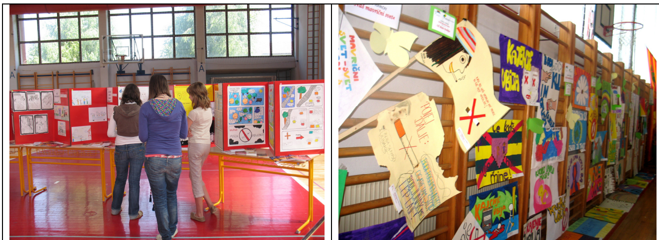
Slika 5. Izložba s radovima s natjecanja: »DA!- za nepušenje«