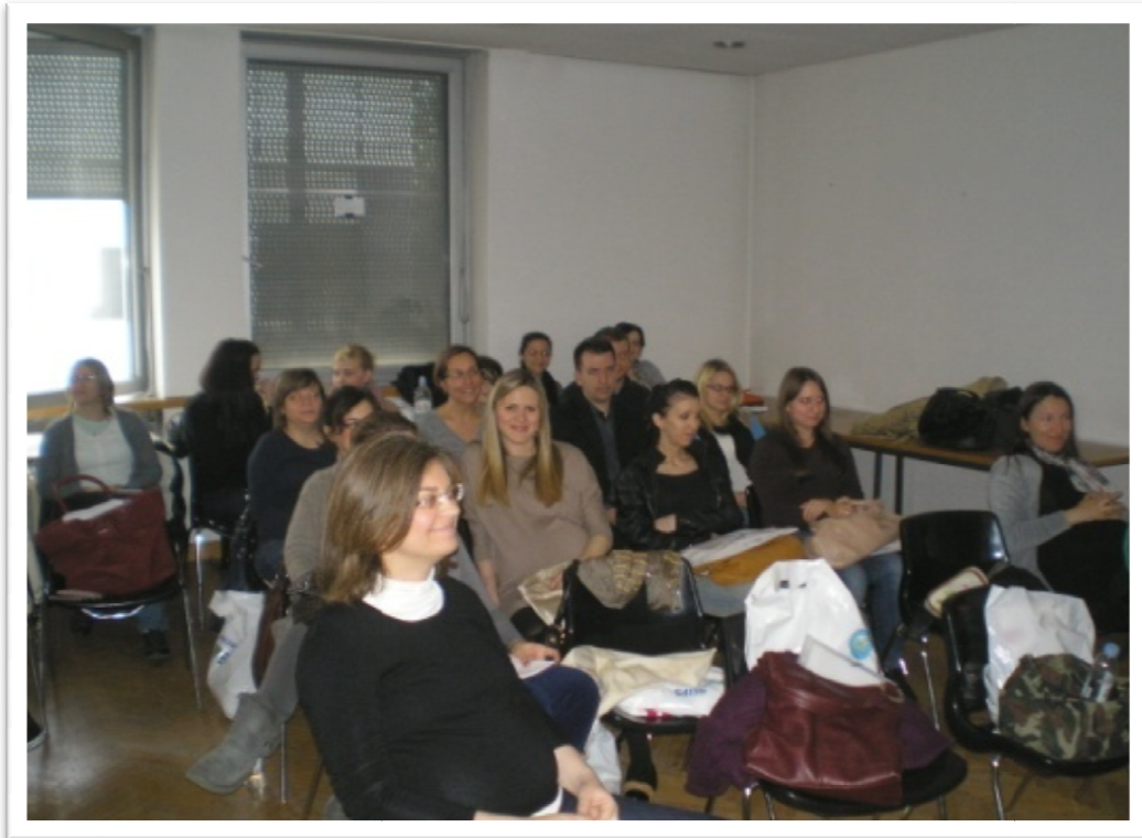
Slika 1. Trudnički tečaj u Domu zdravlja Zagreb-Centar, Runjaninova 4 (travanj 2012. godine)