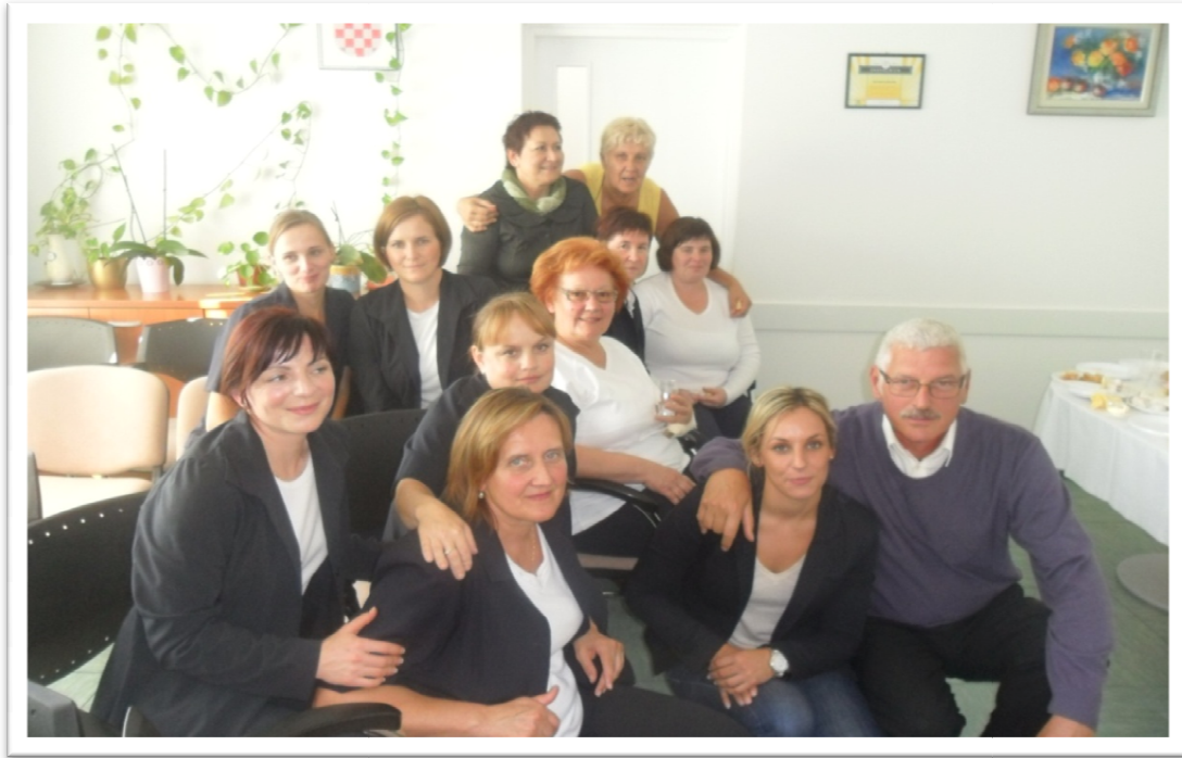
Slika 2. S obilježavanja 10-godišnjice trudničkog tečaja u DZ BBŽ