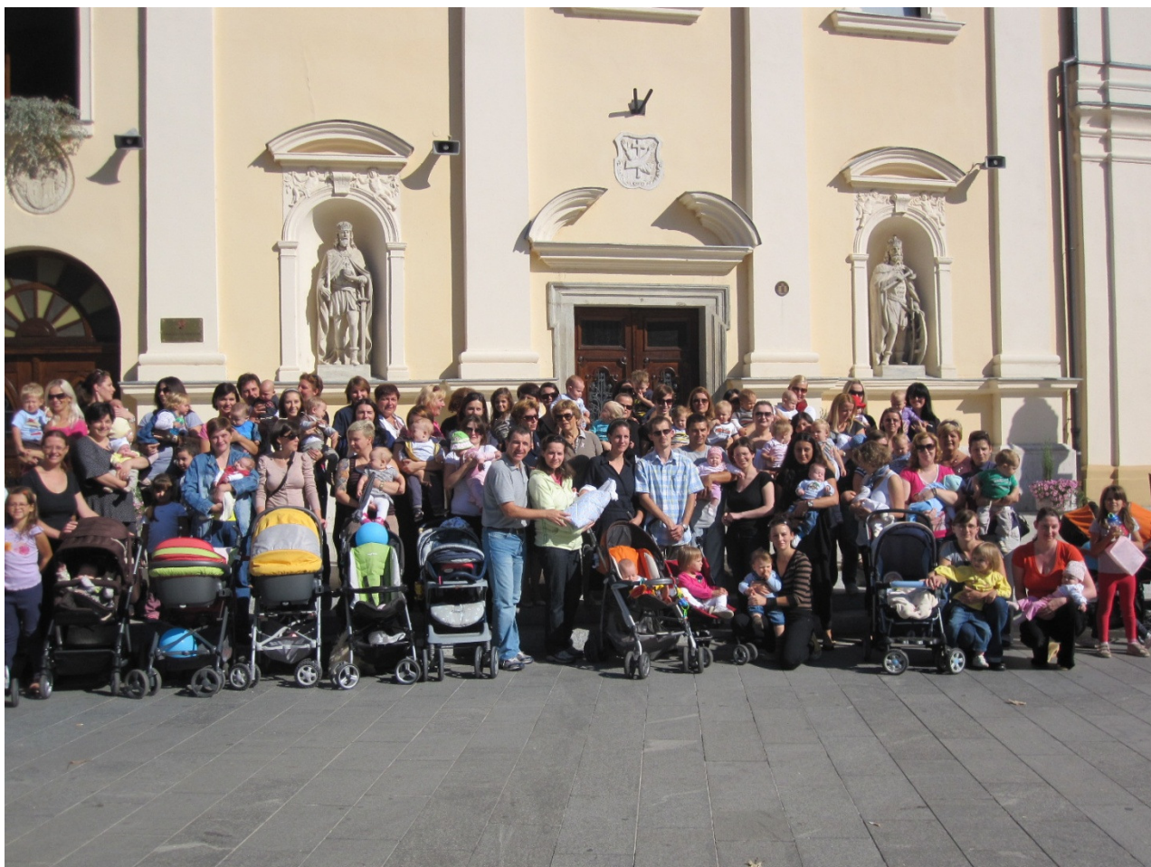
Slika 1. Obilježavanje Nacionalnog tjedna dojenja u Čakovcu 2011. godine

Potpora dojenju u lokalnoj zajednici mora biti prijateljski orijentirana prema pojedincu, kreativna i svima dostupna, pa će tada biti sigurno i učinkovita.