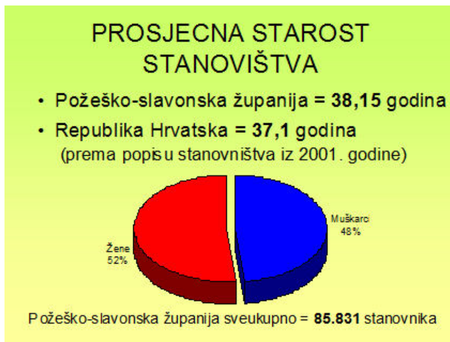
Grafikon 3. Prosječna starost stanovništva u Požeško-slavonskoj županiji

S tim u skladu je i podatak o prosječnoj starosti populacije u našoj županiji. Prosječna starost stanovništva iznosi 38,15 godina što je iznad prosjeka Republike Hrvatske koji iznosi 37,1 godinu. Očekivano trajanje života je u županiji značajno niže od prosjeka Republike Hrvatske. Za muškarce iznosi 69 godina (u državi 72 godine), a za žene 72 godine (u državi 79 godina).