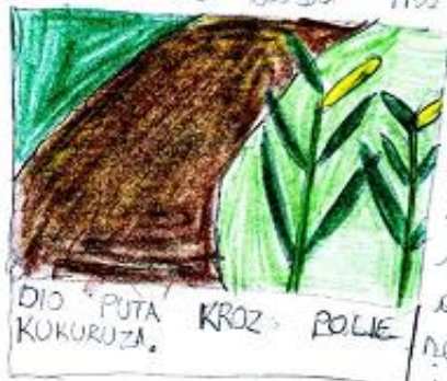
DIO PUTA KROZ POLJE KUKURUZA.

U 9 sati i 15 minuta moja tetka, seba i ja krenuli smo u Šetnju. Krenuli smo iz sela koje se zove Štrožanec. Prvi put počinje od krivine prema Daruvarskom Bratstvu. Nastavili smo ravno i ušli u kumu. Makadamski put je bio pun blata. Zatim smo prošli preko kanala i izišli na livadu. Put vodi preko livade, a potom kroz polje kukuruza. Ovdje je put bio tako blatnjav da se jedva hodalo. Potom smo došli na naselnicu i skrenuli desno. Nakon 250 metara hodanja od naselnice došli smo do nasipa. U obližnjem mjestu, na rječju, imamo malu i razgovornu čamcu kojom se lovila riba.