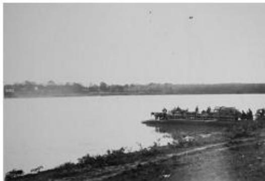
Sl. 5 Sava kod Županje koncem 19. stoljeća

Za izdržavanje karantena morale su biti izgrađene mnoge zgrade za zdrave i bolesne putnike i robu (Martinović, 1912). Primjerice u Županji se jedna takva zgrada najvjerojatnije nalazila na mjestu današnje zidane zgrade smještena uz lijevu obalu Save pored Čardaka. Ona je kako se pretpostavlja bila sagrađena od drvene građe (vidi sl. 4) i zvali su je raštelj ili raštel te je vjerojatno služila za raskužavanje ljudi i robe uz tadašnji granični prijelaz ( sl. 5).