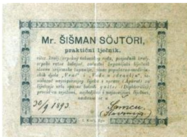
Sl. 1 Curriculum liječnika, kraj 19.st., Povijesna zbirka Muzeja u Županji

sakupljati čak i dobrovoljni prilozi od imućnijih graničarskih obitelji. Stoga su upravo zahvaljujući pučanstvu, navodi se u nekim izvorima (Tkalac, 1970.) ostali ovdje raditi te bili na raspolaganju kako vojnicima tako i ostalom pučanstvu. Sjedište jednoga kirurga prije 1785. godine bilo je u Šamcu te je kasnije preseljeno u Babinu Gredu (sl. 1).