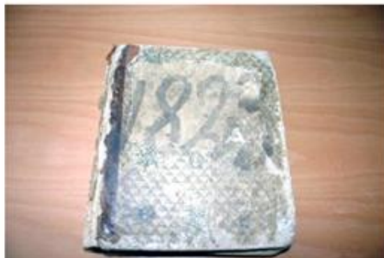
Sl. 3 Knjiga Babogredske zapovidi iz 1823. 1824. godine, Povijesna zbirka Muzeja u Županji

već 1713. godine. Crne boginje vladale su u nekoliko kuća u Babinoj Gredi 1833. godine. Da se ne bi bolest dalje širila, nitko nije smio ulaziti u takove kuće, te niti njihovi stanovnici izlaziti iz kuća u selo. Sve kuće koje su imale bolesnike sa boginjama, morale su objesiti na kući izvana na zid manju ploču. Na ploči je doslovno pisalo: »U ovoj kući jesu naravske kozjače«. Moglo je biti napisano i kredom. Kolera se pojavila 1836. god., te se od nje razboljelo 15 lica. Regimenta je izvanredno poslala dva liječnika. Imali su epidemijski dodatak od 5—50 forinti. Dio prethodno spomenutih zabilježaka navedeni autor objavio je iz rukopisne građe koja se nalazi pohranjena u Muzeju Županje, a posebice u knjizi Zapovidi babogredske kumpanije u kojoj su zabilježne sve zapovjedi koje su proglašene iz 1823. i 1824, došle iz sjedišta Kumpanije u Babinoj Gredi (sl. 3).