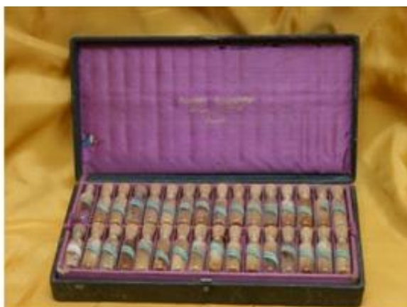
Sl. 2 Homeopatska priručna ljekarna, kraj 19. st., Povijesna zbirka Muzeja u Županji

Iako kirurzi u prvoj polovini 18.stoljeća nisu imali nikakvu posebnu stručnu naobrazbu liječili su besplatno vojna lica, a pučanstvo je posebno plaćalo kirurga i lijekove (sl. 2). Tek u prvoj polovini 19. stoljeća poboljšava se njihova naobrazba, a time i zdravstvene usluge uopće. Bolesni vojnici se tada nazivaju «marodije» (franc. maraudeur) za razliku od svih ostalih.