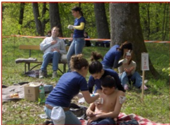
Radionice s igrom za prevenciju ovisnosti «DAN i NOĆ»