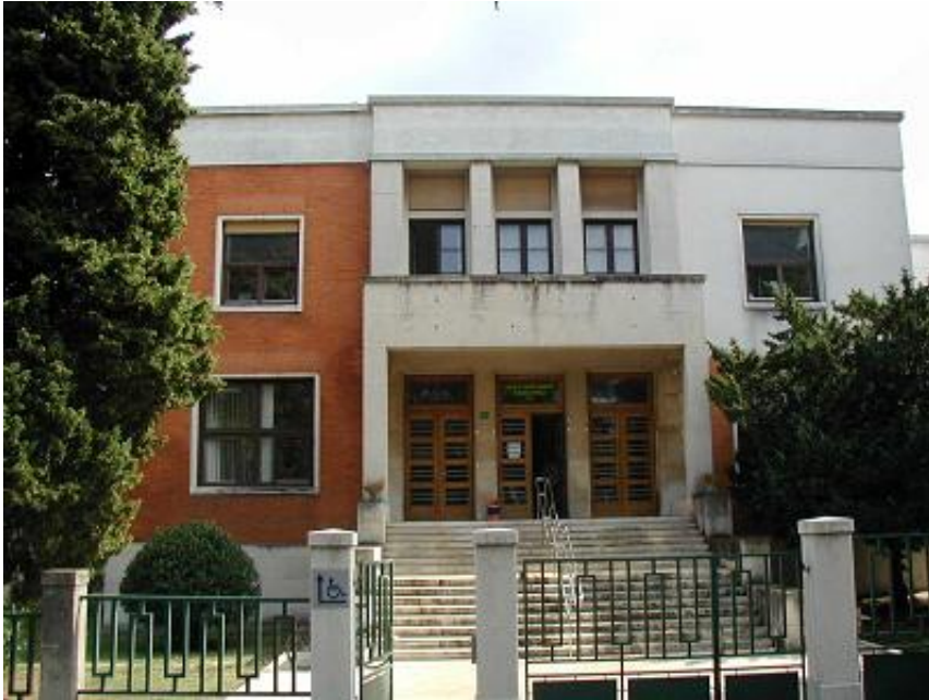
Slika 3. Zavod za javno zdravstvo Istarske županije - danas

Prava vizija, ostvarenje javnog zdravstva odnosno brige o zdravlju naroda kako je to zamišljao njen osnivač naš učitelj dr. Andrija Štampar može istinski zaživjeti samo uz upornost, znanje i htijenje u zdravstvu, politici i svakom pojedincu naše Županije.