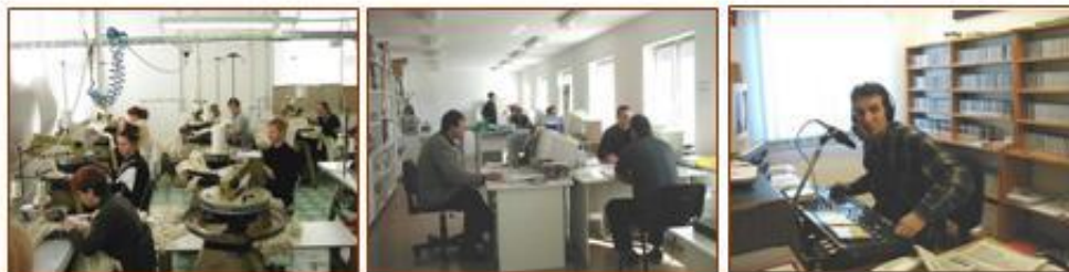
Neke od poduzetničkih aktivnosti u Inkubatoru

2001.g.proglašen NAJBOLJIM Inkubatorom u Republici Hrvatskoj.