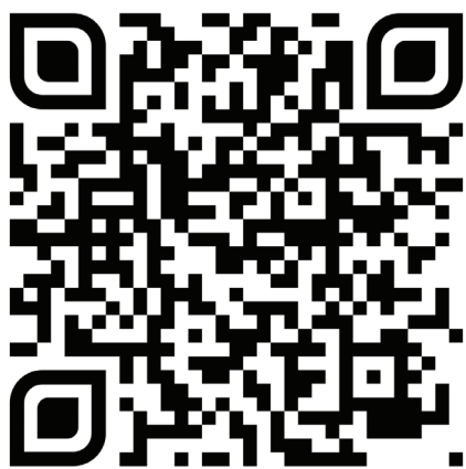
Poveznica na Padlet ploču.

Mogu zaključiti da je ovo bila jedna odlična suradnja roditelja i škole. Učitelji na ovaj način mogu dobiti prave stručnjake i suradnike u ostvarivanju postavljenih ishoda, a roditeljima pruža zadovoljstvo što su svojim doprinosom obogatili rad škole i zajednice.