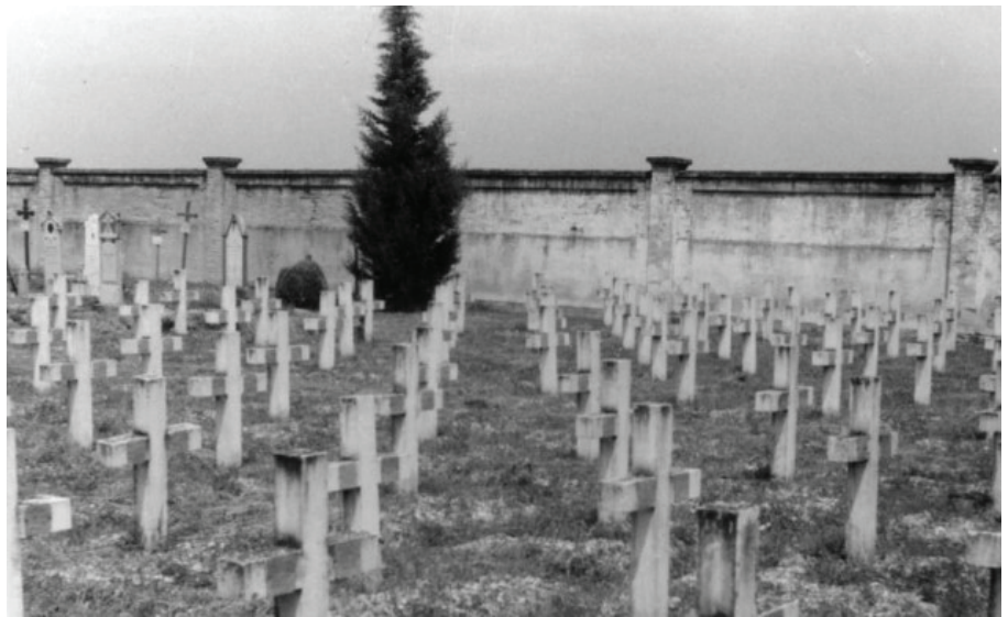
Groblje u Gonarsu.

Groblje u Gonarsu također je prepuno čabarskih logoraša. Tu je svoj život završilo njih 423. Čabarske žrtve na tome groblju čine dvije trećine umrlih logoraša.