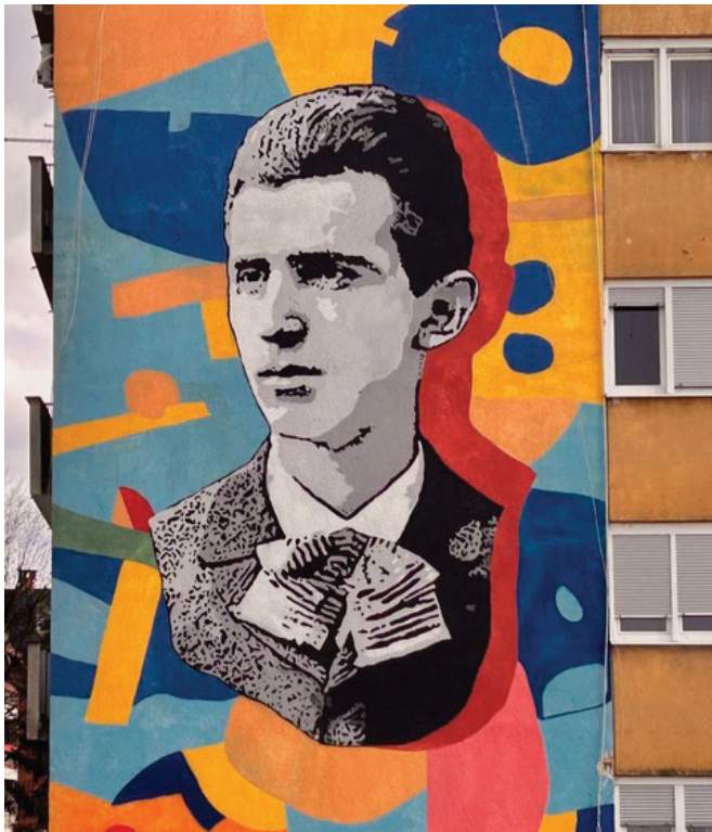
SLIKA/FIGURE 1. Mural: Nikola Tesla. Autor: Leonard Lesić. Izrađeno na zgradi Izidora Kršnjavog 10 u Karlovcu u svibnju 2021. g. / Mural: Nikola Tesla; author: Leonard Lesić Painted in May 2021 on the building at Izidora Kršnjavog Street 10, Karlovac

ja sa Zagrebom i 150. obljetnicu spajanja s Rijekom [3, 4]. Karlovac je jedan od rijetkih gradova čiji je datum osnutka poznat. Odluku o osnutku donijeli su predstavnici staleža austrougarskih pokrajina i njemačkih zemalja prije 445 godina na Saboru u Brucku na Muri. Godinu dana kasnije, 13. srpnja 1579. godine, na čelu s Franzom Poppendorffom, predsjednikom dvorskog ratnog vijeća, počinje izgradnja tvrđave. Tim se datumom obilježava osnutak Karlovca, odnosno Dan grada.