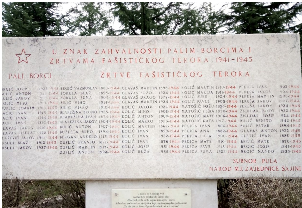
SLIKA 5. Spomenik nedužnim civilnim žrtvama (siječanj 1944.) u selu Šajini FIGURE 5 Monument to innocent civilian victims (January 1944) in the village of Šajini

ovu rutu memorijalnog turizma, kao i u gore navedenim slučajevima, moguće je tematski povezati s potencijalnim rutama koje uključuju ostale istarska regije. Iako ova ruta ima veliki potencijal memorijalnog turizma uključujući veliku mrežu komercijalnih turističkih smještaja i dobro organiziran javni prijevoz, glavni nedostatak je disonantna baština povezana s tragičnim, uznemirujućim, šokantnim povijesnim događajima i neljudskim zločinima.