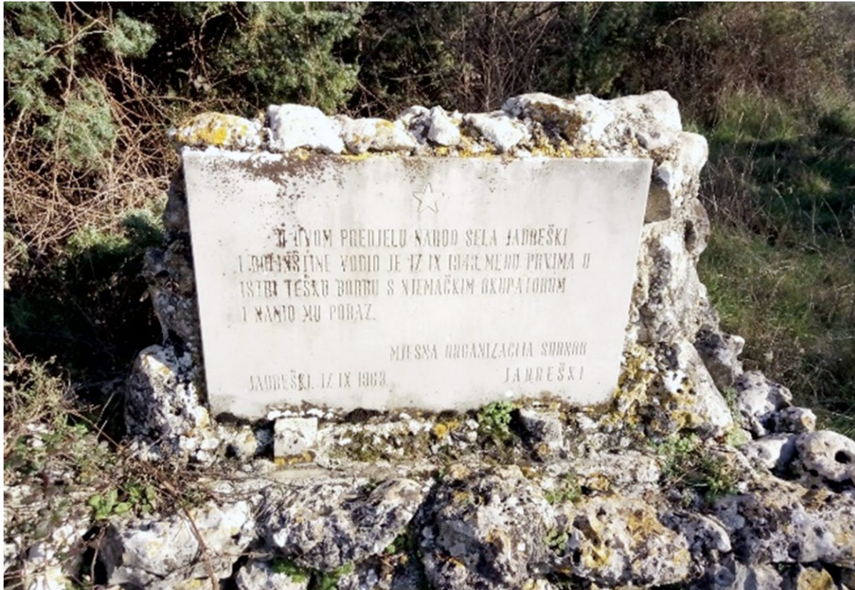
SLIKA 4. Spomenik bitki u šumi Magran (1943.) u općini Ližnjan FIGURE 4 Monument to Magran forest battle (1943) in Ližnjan Municipality

kovski 2011.). Kao i na prethodnoj ruti, spomenici i lokaliteti duž ove rute smješteni su uz asfaltirane javne ceste i dobro su povezani lokalnim i regionalnim autobusnim prijevozom. Prednost rute je povezanost sa sličnim rutama u ostalim istarskim regijama.