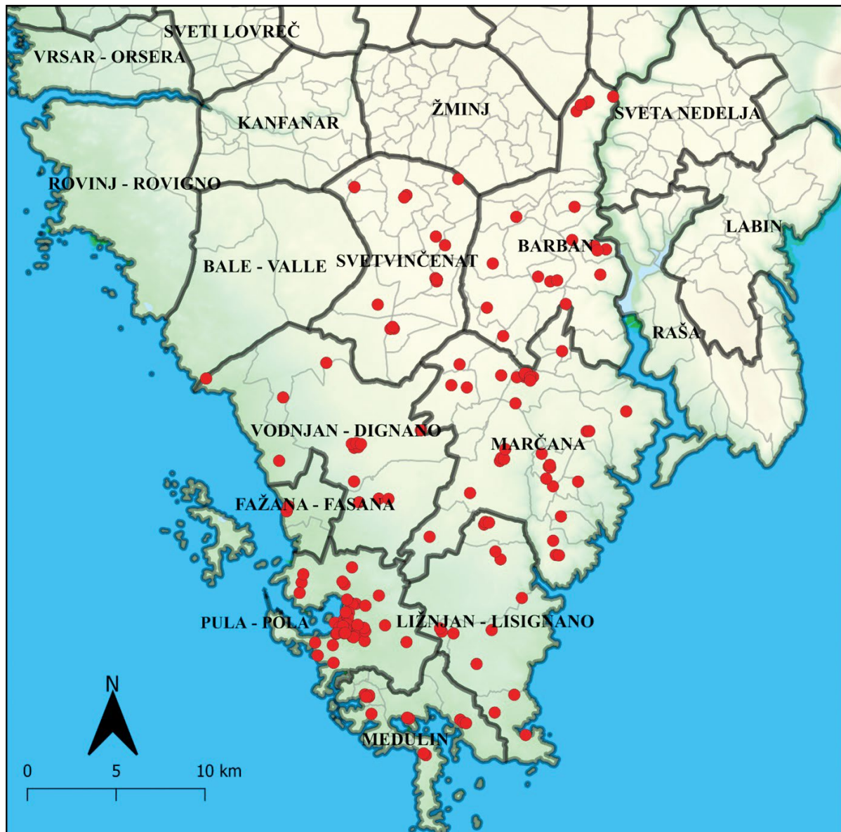
SLIKA 2. Prostorni raspored materijalne baštine antifašizma i Južnoj Istri FIGURE 2 Spatial layout of the tangible antifascism heritage in Southern Istria

tenziviranje i koncentraciju povijesnih događaja i procesa vezanih uz oružani otpor, oružane sukobe i bitke protiv fašizma (DRNDIĆ, 1978.; DUKOVSKI, 2001.; GIRON, 2004.; BURŠIĆ, 2011.). Prostorni raspored materijalne baštine antifašizma po administrativnim jedinicama Južne Istre potvrđuje prisutnost ovih spomenika i lokaliteta u svih šest općina i dva grada (Sl. 2.)