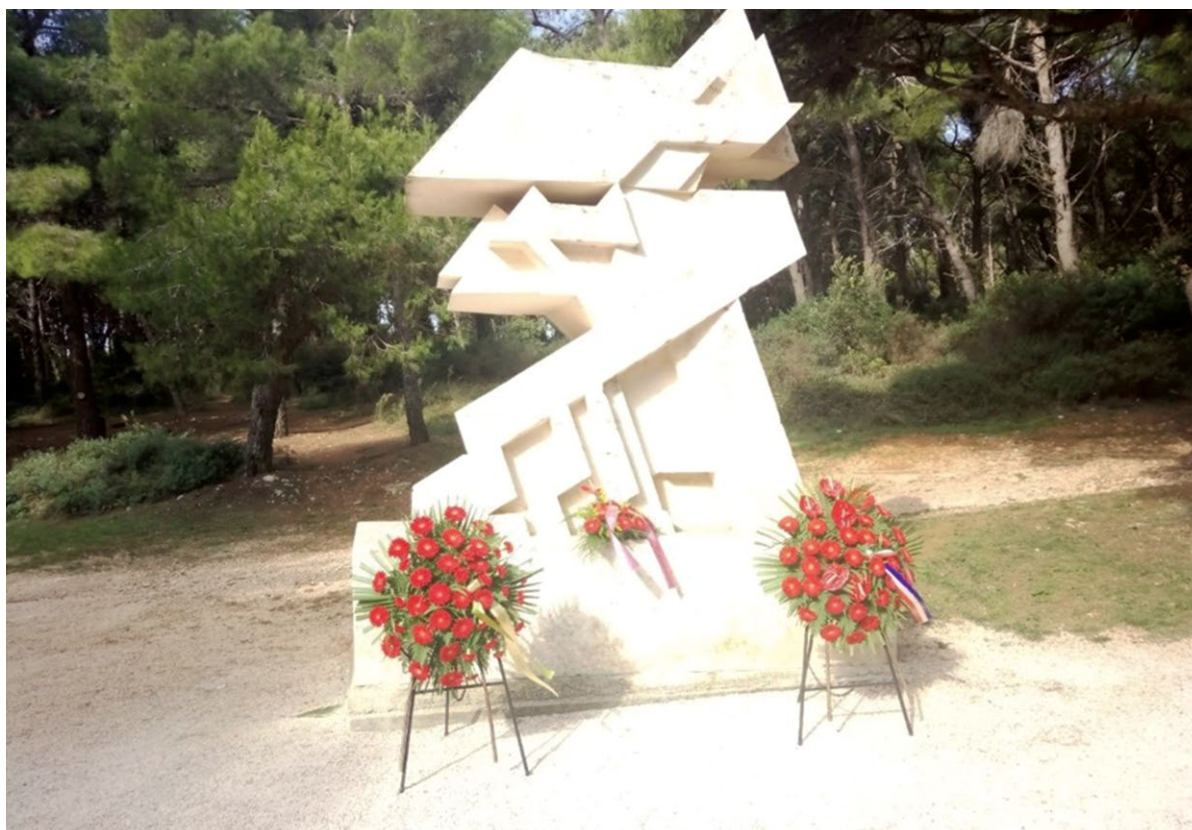
SLIKA 6. Spomenik na mjestu strijeljanja antifašiste Vladimira Gortana (1929.)