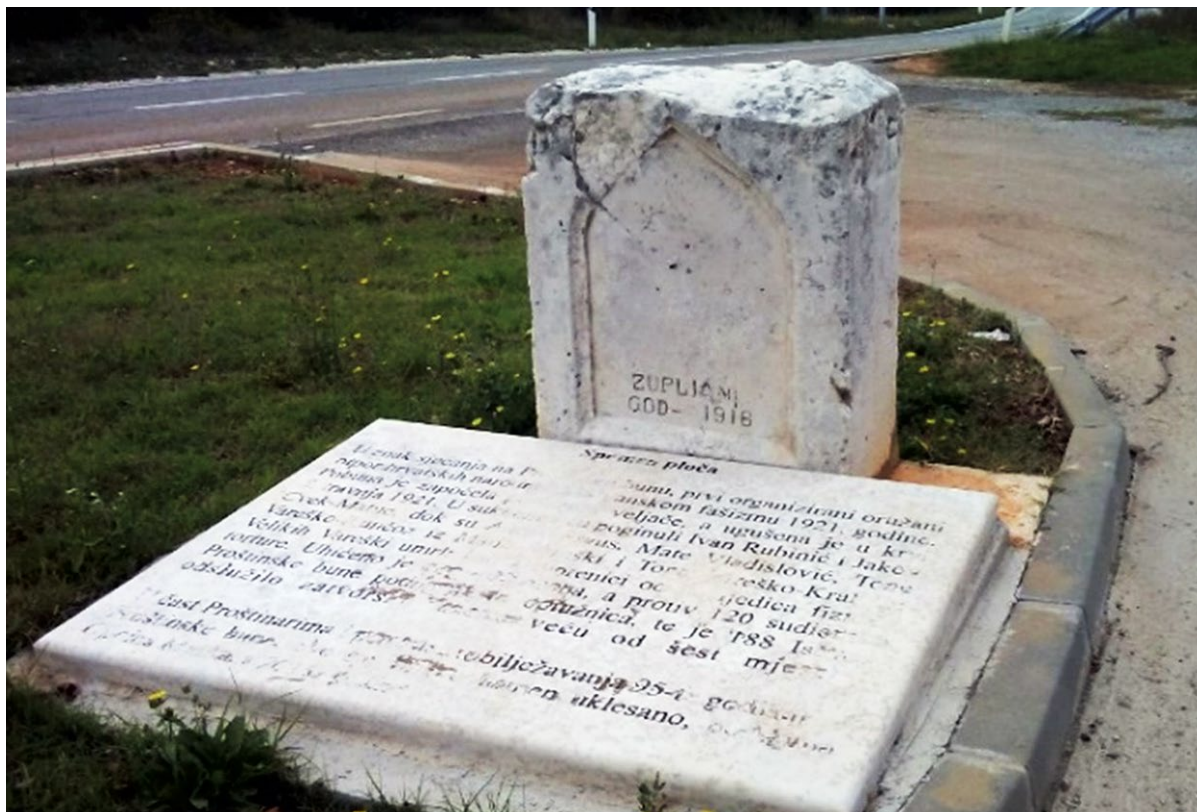
SLIKA 3. Spomenik Proštinskoj buni (1921.)

Route of the resistance to fascism in interwar period (1918 – 1943). The most important antifascism monuments and sites of this memorial tourism routes are in the town of Pula, where seven potential