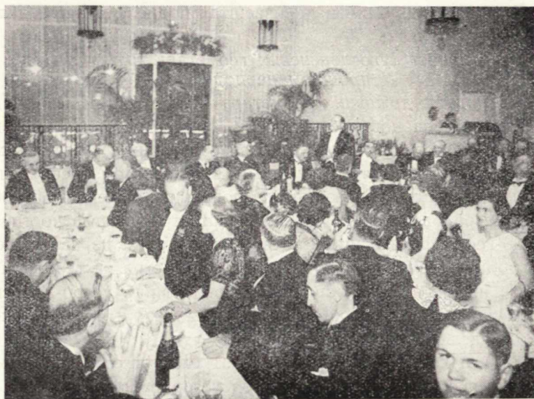
Делегати на међународном конгресу у Паризу: Другарско вече