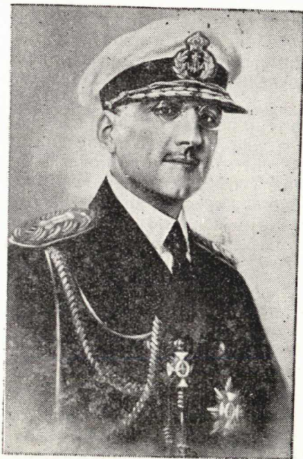
Витешки Краљ Александар Први Ујединитељ

Излази у два ме- сеца једанпут. Поједини број 10 дин.