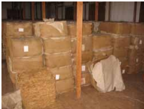
Otkupljeni duhan-Duhanska stanica Stolac (2009. god.)

Količina otkupljenog duhana na području Hercegovine varirala je u ovisnosti od godina proizvodnje. Potrebno je uzeti u obzir činjenicu kako je Uprava državnih monopola diktirala odnosno odobravala količine duhana koji će se pojedine godine posaditi u Hercegovini. Od toga je onda ovisio i konačan urod te količina otkupljenog duhana. Proizvođači su kontinuirano zahtijevali izmjenu zakona i pravilnika monopolske politike, a sve kako bi imali veću mogućnost produkcije duhana te su poticali izgradnju dodatnih skladišta za duhan. Međutim Uprava monopola nije pridavala posebnu pažnju njihovim zahtjevima. Obično bi se pravdali kako su skladišta puna duhana, da za duhanom nema potražnje i