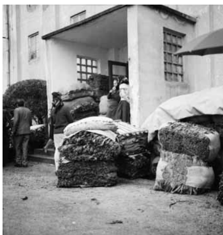
Otkup duhana u Hercegovini

Iz tablice je uočljivo kako su u pogledu otkupa duhana u Hercegovini rekordne godine bile 1940. godina (8.576.816 kg), 1957. godina (10.038.056 kg) i 1976. godina (12.290.000 kg). Po niskoj produkciji duhana ističu se 1880. godina (877.400 kg), ratna 1943. godina (1.995.737 kg) te 1961. godina kada je otkupljeno svega 1.735.531 kg jer je plamenjača uništila tri četvrtine očekivane proizvodnje (slika 5).