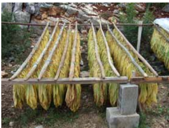
Sušenje duhana na suncu

u to doba vaga značila sve, od procijene duhana ovisila je egzistencija njihovih obitelji.