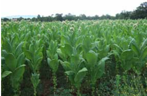
Proizvodnja hercegovačkog duhana