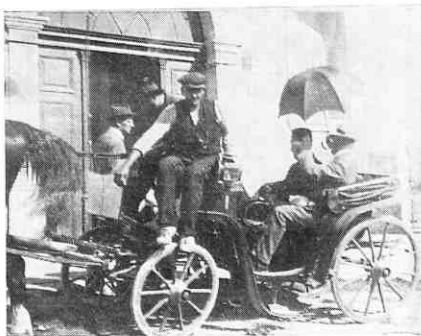
... na bizantološkom kongresu u Bukureštu 1924. godine