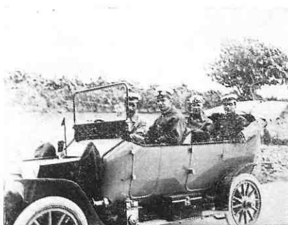
...na izletu za vrijeme studija