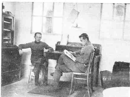
...u vojsci (okolica Gline)