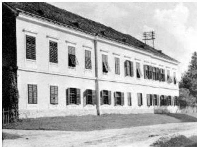
Dvorac Kiepach u Križevcima, srušen 1966. nakon urušenja jednog dijela zgrade

Gotovo da i nema u Križevcima pripadnika starije generacije koji nije uo za vlastelinsku obitelj Kiepach u Križevcima. Ve se i sadašnji pedesetogodišnjaci još sje aju ostataka Kiepachovoga dvorca koji se nalazio u današnjoj ulici Kralja Tomislava, na mjestu parkirališta, izgra enog u produžetku nebodera i stambenih zgrada, s lijeve strane ceste koja vodi prema željezni kom kolodvoru. Oni, pak, mla i, mogu se s Kiepachovim imenom sresti na križeva kom Gradskom groblju, na obiteljskoj grobnici koja se nalazi na svega desetak metara od ulaza na groblje, s lijeve strane glavne aleje. Jedan manji broj stanovnika grada dnevno se susre e s prezimenom Kiepach jer stanuju u ulici, uz križeva ku Šumariju, koja nosi ime upravo Marcela Kiepacha.