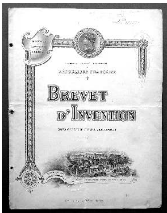
Patentno pismo za dinamo iz 1912.

izum: Strujni prekidač za rentgenske aparate , koji je djelovao na principu tlaka plina. Jedan od važnih njegovih patenata je i Mali transformator za niski napon kojega prijavljuje zajedno s poznatim konstruktorom Heinrichom Weilandom. Ovaj mali transformator proizvodio je niski napon za razne