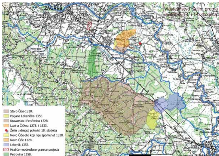
Karta 2. Posjedi vlastelinstva Želin prema izvorima iz 13. i 14. stoljeća (na podlozi: Topografska karta Hrvatske 1:200000, izvor: Geoportal, https://geoportal.dgu.hr/ )

Prema opisu granica Čičanskog preceptorata iz 1328., analiziranim u Prilozima 3 i 4, Čičan se nalazio na području današnjeg starog Čiča. Kravarsko i Peščenica su se pak nalazili na području južno od rijeke Bune, odnosno rasprostirali su se na južnom dijelu današnje katastarske općine Šiljakovina (južno od potoka Šiljak), zatim na području današnjih naselja Kozjača, Čakanec, Ključić Brdo, Žitkovića, Novo Brdo, Velika Buna, Kravarsko, Gladovec Kravarski, Pustike, Cerje Letovaničko, Podvornica, Vukojevac, Peščenica, Brežane Lekeničke te na zapadnom dijelu današnjeg Lekenika (Karta 2). To je, dakle, dio koji je nakon odlaska Ivanovaca bio pripojen želinskom vlastelinstvu. No, uz to, kao što je pokazano u Prilogu 5, na osnovi reambulacije posjeda Pusta Dužica iz 1358. može se zaključiti da Želinu pripadaju i Poljana Lekenička te praktički cijeli prostor današnje katastarske općine Lekenik, od potoka Lekenik na sjeveru, Odre na istoku i granica Dužice na jugu. Prema reambulaciji posjeda Čičanskog preceptorata iz 1328. taj prostor nije bio dio preceptorata. Odgovor na pitanje kako i kada su ta imanja pripala želinskom vlastelinstvu zahtijeva daljnje istraživanje.