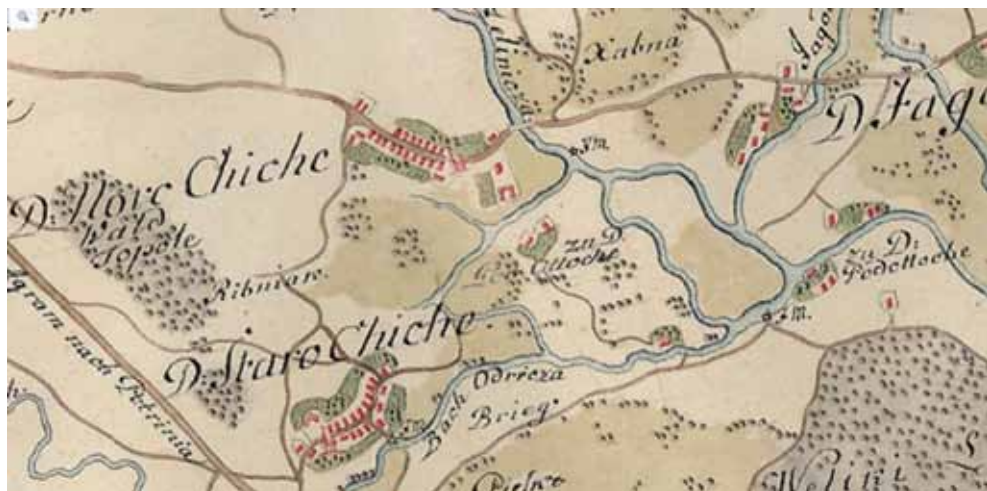
Karta 1. Novo Čiče, Crkva sv. Ivana Krstitelja i Podotočje na Prvoj vojnoj karti