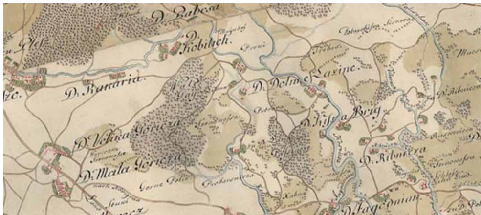
Karta 4. Rakarje, Kobilic i Lazina u drugoj polovici 18. stoljeća

Naselje Rakarje smješteno je sjeverno od Velike Gorice, između Kobilica i Plesa. Prema reambulaciji granica posjeda prodanog 1278. je počinjala na istoku na nekom brdašcu i tu je posjed graničio i s posjedom bana N. i posjedom comesa Miroslava. Ban N. je skraćenica za Nikolu Gut-Keleda, tadašnjega slavonskog bana. Većinu točaka te granice se ne može razaznati u današnjem okolišu. No, ovdje je bitna sjeverna i istočna granica posjeda, odnosno "rijeka" Rakarje, zemlja Ivana i banska zemlja. Tok potoka koji je tekao kroz Rakarje je pokazan na Prvoj vojnoj karti. Njegovim tokom granica je išla prema sjeveru, gdje je danas naselje Kobilic i gdje se vjerojatno nalazio Ivanov posjed. Ivan je dakle kupio komad zemlje koji se naslanjao na posjed koji je on već imao. Budući da je granica započinjala na mjestu gdje su se spajali banski posjed i Ivanov posjed, to je prema logici opisa moralo biti južnije od Kobilica, što je opet prostor današnje Lazine Čičke. Zemlja bana Nikole bila je južnije od te točke, na mjestu gdje se doticala Ivanova i banska zemlja. Ako pogledamo kartu, južno od Kobilica je mjesto Lazine, današnja Lazina Čička. Na katastru iz 1862. rubni dio katastarske općine Lazine se još uvijek zvao Želinski gaj. Da je prostor Lazina bio dio želinskog imanja potvrđeno je i u kasnijim izvorima. Dakle, ovdje citirani kupoprodajni ugovor potvrđuje da je i 1278. prostor Lazine bio prostor banskog imanja Želin.