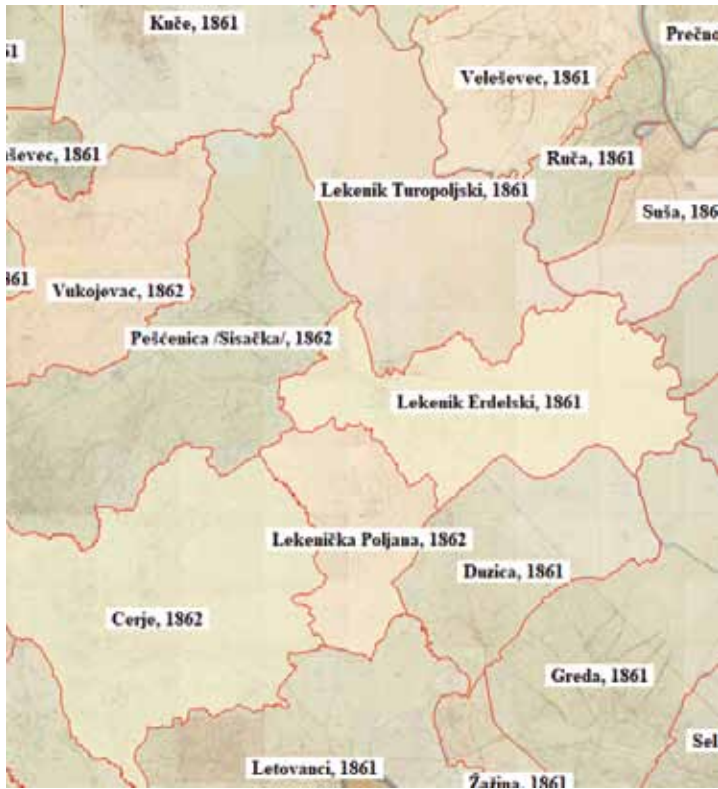
Karta 6. Lekenik Erdelski, Dužica i Poljana Lekenička na katastarskoj mapi iz 1861.

Kako se želinsko vlastelinstvo proširilo na Lekenik Erdeljski odnosno Poljanu Lekeničku za sada ostaje otvoreno pitanje. Što se Lekenika tiče, treba naglasiti da kada Ivanovci iznajmljuju Malu Peščenicu i Lekenik comesu Perčinu i njegovu bratu 1275., oni im dozvoljavaju i korištenje šuma, svih osim šume Ovas. 177 Gdje se točno ta šuma nalazila nije precizirano, pa možda postoji mogućnost da je bila negdje na prostoru Lekenika Erdedskog ali ne pripojena glavnom dijelu posjeda, pa kao takva i nespomenuta u opisu granica. No, i nije morala biti. Na kraju isto tako treba napomenuti da postoje izvori koji bi mogli donekle razjasniti što se događalo na prostoru oko Lekenika i Poljane Lekeničke prije 1358., na primjer opisi biskupskih i kasnije kaptolskih posjeda u sklopu kojih je i prostor Dužice. 178 No, međaši opisani u tim izvorima nisu lako odgonetljivi te bi to svakako zahtijevalo detaljnije daljnje istraživanje.