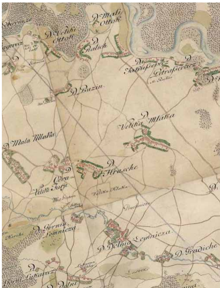
Karta 3. Hrašće i okolna naselja u drugoj polovici 18. stoljeća (izvor: Arcanum Maps, Europe in the XVIII century)

i to na temelju ne samo izvora iz 13. i 14. stoljeća već i kasnijih. Za sada se okvirno može reći da se čini da je zemlja koja je pripadala turopoljskim plemićima bila smještena oko Lomnice i današnjeg naselja Hrašće, a zemlja Želina nešto sjevernije, do granice današnjeg Jakuševca. U prošlosti se istočno od Jakuševca nalazio posjed Petruševac. U opisu granica Petruševca iz 1425. dio granice u jednom trenutku ide uz posjed Hurchin Stjepana, sina Lukača na zapadnoj strani a nakon toga ide prema istoku do posjeda Staneca, građanina Gradeca, nakon čega granica nastavlja dalje prema sjeveru. 142 Posjed Hurchin se nalazio na prostoru današnjeg Mikčevca, a istočno od njega je možda bila čestica zemlje Hrašća, u vlasništvu građana Gradeca, iako nije isključeno da se Stanecov posjed mogao nalaziti i unutar granica Velike Mlake.