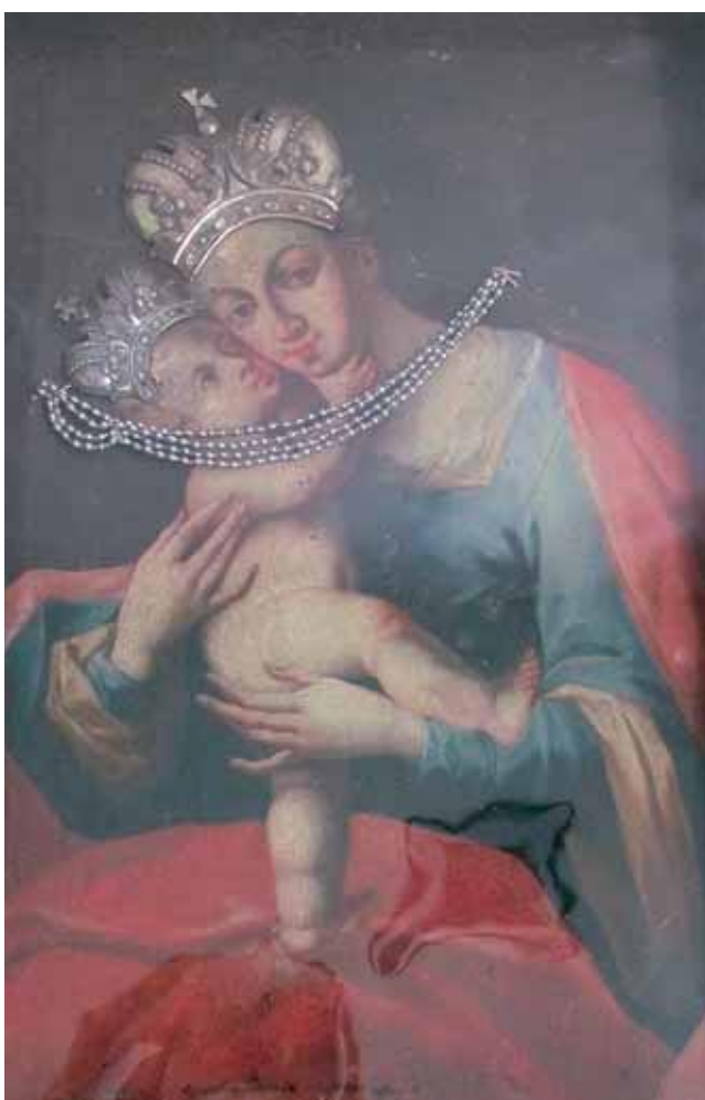
Sl. 3. neutvrđeni slikar Marija Pomoćnica , 18. stoljeće, ulje na platnu, 51 x 33 cm, Kapucinski samostan, Osijek

U osječkom kapucinskom samostanu sv. Jakova čuva se Marija Pomoćnica , djelo neutvrđenog slikara iz 18. stoljeća. (Sl. 3)