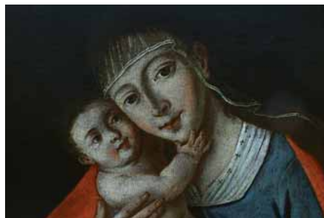
Sl. 2. neutvrđeni slikar: Marija Pomoćnica , detalj slike

križića. Preko ramena joj je i preko nogu prebačen crveni plašt, naglašavajući trokut kompozicije. Transparentni veo s istaknutim bijelim rubom prekriva cijelo Bogorodičino čelo te raspuštenu kosu koja joj pada po lijevom ramenu. Nježno je, iako pomalo ukočeno, objema rukama prihvatila Djetetovo bucmasto tijelo – lijevu je ruku podvukla između Isusovih nožica, desnom mu pridržava trup. On lijevom nožicom, na koju se oslanja, stoji na majčinim koljenima, desnu je nogu podigao na lijevu Marijinu podlakticu. Nježnost se između tih likova posebno očituje u zagrljaju – Isus svojom desnom ručicom miluje Marijinu bradu, lijevom ju je zagrljao i obraz priljubio uz majčin. Isusovo tijelo te Marijino lice i dekolte izrazito su bijeloga inkarnata, s naglašeno rumenim obrazima. Dok je Isusova glava okrugla s bucmastim obraščićima i malenim nosom, Marijino je lice trokutasto, sa šiljatom bradom. Krupne tamne oči i naglašen luk obrva koje prelaze u izduženi nos te srolika usta podsjećaju na produhovljeni ideal ljepote ikona. (Sl. 2)