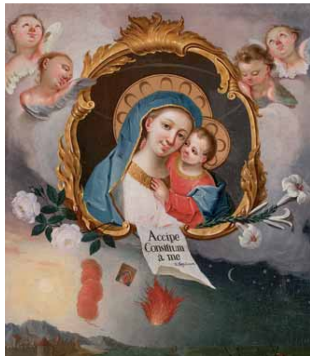
Sl. 7. Fortunat Bergant. Majka Dobrog Savjeta , 1766., ulje na platnu, 100,2 x 84,4 cm, crkva sv. Andreja, Mošnje, Slovenija

U opusu Fortunata Berganta sakralno slikarstvo važan je segment u okviru kojeg se ističu prikazi Marije s Djetetom. Pritom je upravo Majka Dobrog Savjeta najbrojniji ikonografski tip, a uglavnom je riječ o slikama manjeg formata namijenjenim ili za ukras oltarne menze ili osobnu pobožnost. Iznimka je oltarna pala iz crkve sv. Andrije u naselju Mošnje kod Radovljice, jedan od rijetkih prikaza prijenosa slike preko Jadrana. (Sl. 7).