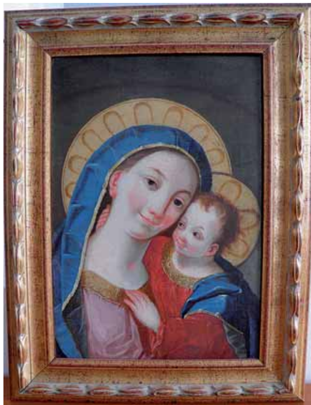
Sl. 6. Fortunat Bergant. Majka Dobrog Savjeta , 1760-ih, ulje na platnu, 44,5 x 30,5 cm, Muzej Slavonije, MSO-156008

Još se jedna barokna slika Bogorodice s Djetetom slikana uljem na platnu čuva u Muzeju Slavonije. (Sl. 6)