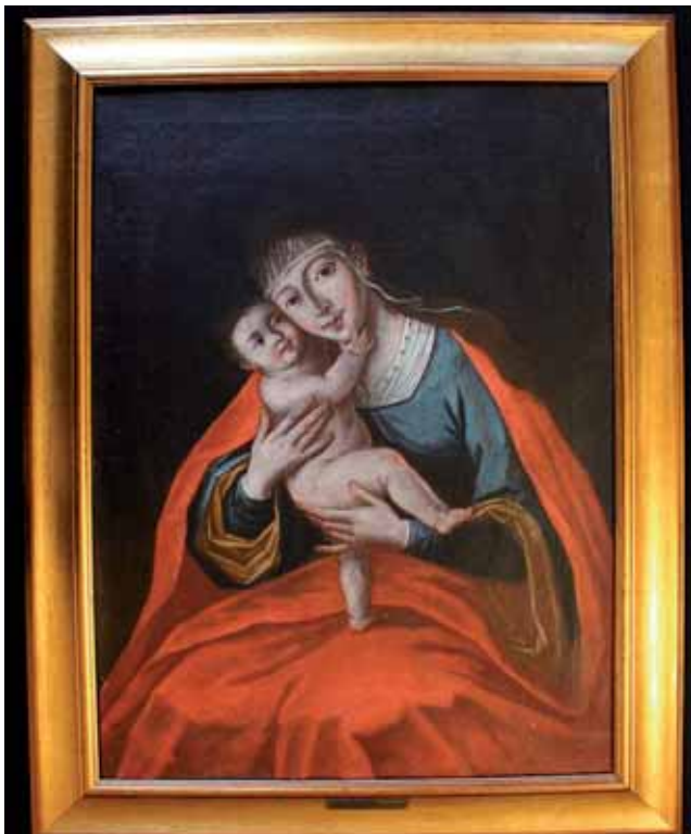
Sl. 1. neutvrđeni slikar: Marija Pomoćnica , 18. stoljeće, ulje na platnu, 68 x 50 cm, Muzej Slavonije, MSO-2362II

Muzej Slavonije otkupio je 2020. sliku Bogorodica s Djetetom načinjenu uljem na platnu u drvenome pozlaćenom recentnom okviru. (Sl. 1)