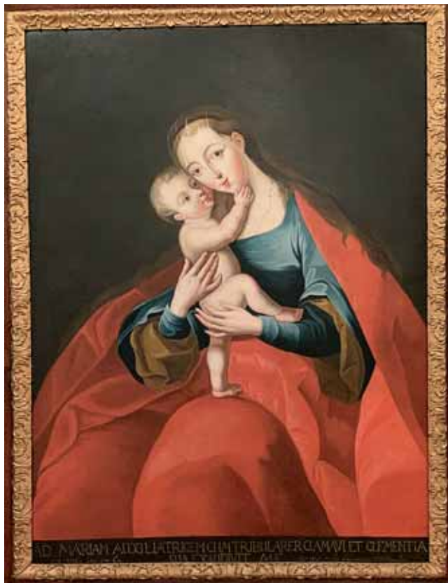
Sl. 5. neutvrđeni slikar: Majka Božja Pomoćnica , 1760., ulje na platnu, 150 x 112 cm; Virovitica, Franjevački samostan, foto: fra Bernard Barbarić

Ikonografski tip dosljedno je proveden u svim slikama, razlike su u detaljima fizionomije i obrade draperije, detaljima poput Isusove ručice na Marijinoj bradi, načina na koji je Isus priljubio svoj obraz uz majčin i kako je oslonio desnu nožicu na njezinu ruku.