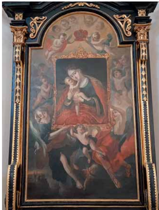
Sl. 4. Paulus Antonius Senser Marija Pomoćnica u nebeskoj proslavi nad Tvrđom , oko 1755., ulje na platnu, 178,5 x 98,5 cm; Osijek, ž.c. sv. Mihaela, foto: Andreja Šimičić

umjetničkog kruga. 19 U osječkoj župnoj crkvi sv. Mihaela (nekad isusovačkoj) na pokrajnjem oltaru sv. Marije nalazi se pala Marija Pomoćnica u nebeskoj proslavi nad Tvrđom iz oko 1755. godine. (Sl. 4)