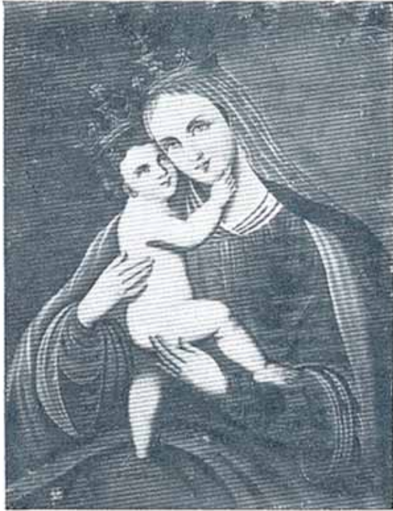
Ilačka Gospa (mjesto Ilača)

Osmanlija, štitili svoje živote i svoju svetu zaštitnicu. Kako ikoničke slike često prate lijepe i zanimljive legende koje u pobožnim srcima ostavljaju snažan dojam, tako se uz prikaz Bogorodice s Djetetom često slika i prijenos čudotvorne slike preko Jadrana na rukama anđela. 40 (Sl. 9)