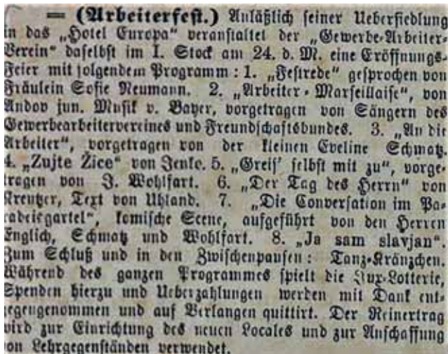
Sl. 1. „Arbeiterfest“, Die Drau XI, XI (24) (nedjelja, 24. 3. 1878), str. 2.