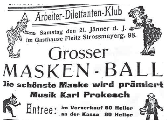
Sl. 3. Veliki bal pod maskama radničkog Diletantskog kluba, Volksrecht V, V (2) (četvrtak, 12. 1. 1911.), str. 4.