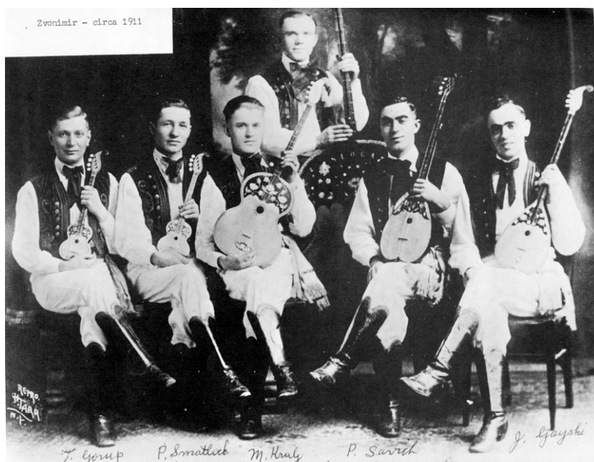
"Zvonimir" — oko 1911. godine