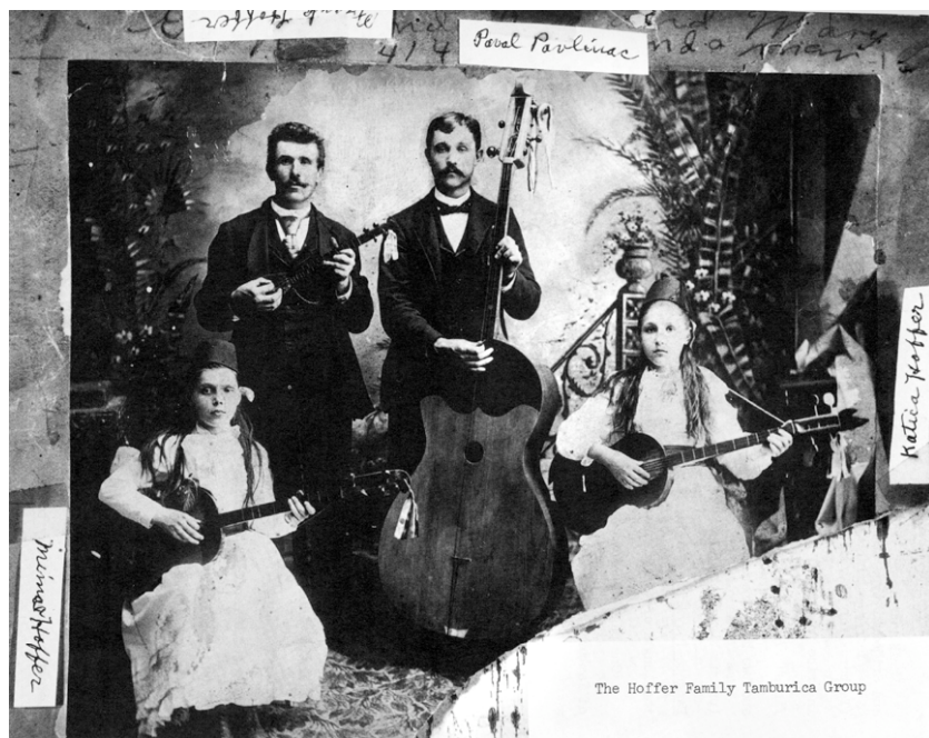
The Hoffer Family Tamburica Group

Posljednje desetljeće devetnaestoga stoljeća i prvo desetljeće dvadesetoga stoljeća poznato je kao doba najmasovnijeg iseljavanja Hrvata u prekomorske zemlje, najviše u SAD. 3 Velik broj bio je iz Hrvatskoga primorja, Dalmacije, Gorskog kotara, Žumberka, okolice Zagreba i Siska. Među njima, kako vidimo, našli su se uz pojedinačne tamburaše i čitavi orkestri. Kako utvrđuje Kolar, s vremenom tamburaški sastavi postaju dio redovitih aktivnosti u svim hrvatskim dvoranama, domovima, bratskim ložama, organizacijama i skupinama. Gdje je bilo hrvatskih ljudi, tamo je bilo i tamburaških sastava (Kolar 1975:5). Zanimljivo je da se priličan broj američkih tamburaša regrutirao iz hrvatskih krajeva gdje je orkestrirana tambura najkasnije dospjela (Gorski kotar, Primorje, Dalmacija s otocima). Razlog je, naravno, najveće iseljavanje iz tih prostora, ali to ujedno dokazuje kako se u tim krajevima tambura u orkestralnom obliku u relativno kratkom vremenu čvrsto ukorijenila.