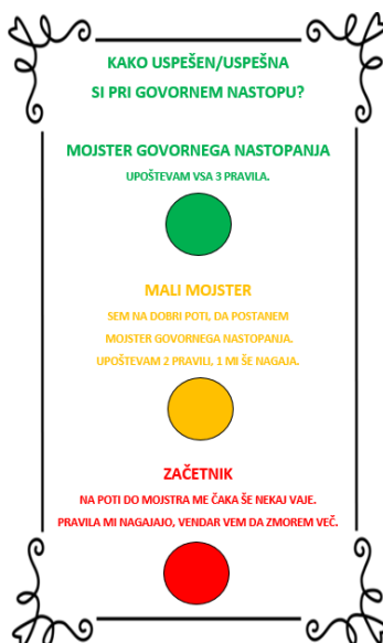
Slika 6: Kriteriji uspješnosti

Imala sam unaprijed pripremljeni plakat s kriterijima, objesila sam ga na vidljivo mjesto.