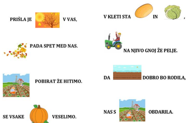
Slika 3: Slikopis

Ključ uspješnog govornog nastupa je dobro poznavanje teksta (uvažavanje neverbalnih elemenata komunikacije slijedi u aktivnostima u nastavku), zbog toga sam odabrala jednostavan tekst koji se tematski nadovezuje na trenutno raspravljani sklop (tj. jesen). Učenici su podijeljeni u četiri skupine. U dvije skupine ulogu »učitelja« preuzeli su tzv. čitatelji. To su bili učenici koji su znali čitati. Tekst pjesme čitali su drugim učenicima i tako vodili proces učenja. Učenici su također imali mogućnost potpore u učenju teksta slušanjem. Mogli su birati između kartica na kojima je pjesma u cijelosti napisana riječima i kartica na kojima je pjesma napisana u obliku slikopisa.