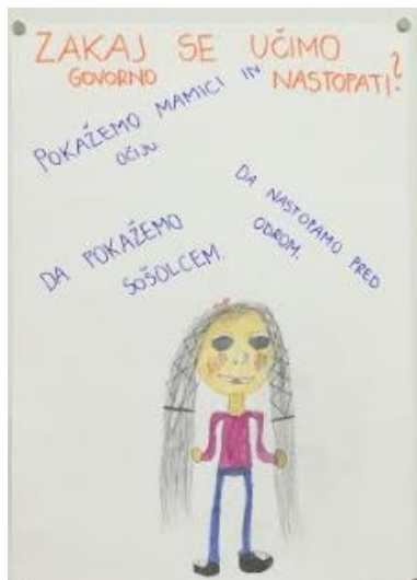
Slika 2: Plakat

Učenici su u skupinama raspravljali o tome zašto uče govorni nastup. Tijekom razmjene mišljenja usmjerila sam ih da traže razloge koji proizlaze iz životnih situacija – gdje i kada su primijetili govorni nastup? Zašto su imali govorni nastup? O čemu su govorili? Kako su se ponašali pri tome? Skupine su razmijenile mišljenja i zajedno smo formirali razloge za učenje govornog nastupa. Razloge smo iznijeli tako da su ih učenici razumjeli i da su proizašli iz njihovog iskustvenog svijeta. Zajedno smo napravili plakat i objesili ga na ploču, gdje je ostao na vidljivom mjestu.