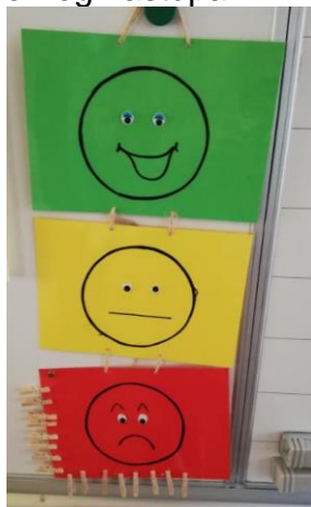
Slika 7: Semafor za samoprocjenu

Za ocjenu govornog nastupa koristila sam semafor. Učenici su drvene štikaljke sa svojim imenima stavili na crvenu boju, što znači da su svi počeli kao početnici. Ključno je da steknu osjećaj da su svi početnici i imaju mogućnost napredovati do malog majstora ili majstora govornog nastupa.