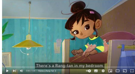
Slika 3: Snimka zaslona YouTube kanala: "There's a Rang Tan in my bedroom"

https://www.youtube.com/watch?v=zyOAKLC7fPc