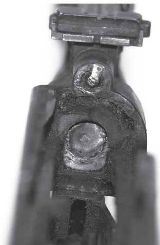
Fotografija 2: Cijev onesposobljena klinom veličine čahure umetnutim u ležište naboja i čvrsto zavarenim te otvor za potiskivač onesposobljen zavarivanjem 30

Isto tako, na fotografiji 2. vidljiv je primjer dijela pravilno onesposobljene cijevi i otvora za potiskivač kod poluautomatske puške sustava Simonov, Model 59/66, proizvedene u bivšoj Jugoslaviji s obzirom na to da prije navedene tehničke specifikacije za onesposobljavanje vatrenog oružja propisuju da se klin veličine čahure mora umetnuti u ležište naboja i čvrsto zavariti te uništiti plinski klip (uklonjen i uništen) i plinski cijev rezanjem ili zavarivanjem, što je u ovom slučaju pravilno učinjeno.