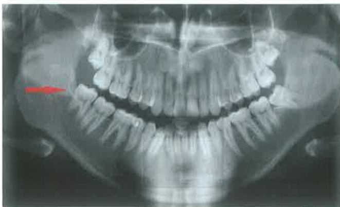
Slika 2. RTG nalaz pacijenta s perikoronitisom (Slika 1) na kojem je uočljiv lokalizirani gubitak kosti.

Antibiotici najčešće nisu potrebni u liječenju perikoronitisa, no ukoliko se propisuju, lijek izbora je penicilinski antibiotik, a u slučaju alergije, klindamicin (25). Ako je klinička slika teža ili su prisutne komplikacije, može se u kombinaciji s penicilinskim antibiotikom propisati i metronidazol. Amoksicilin se propisuje u dozi od 500 mg tri puta dnevno kroz sedam dana, a kombinacija amoksicilina i klavulanske kiseline u dozi od 1 g dva puta dnevno. Terapijska doza klindamicina je između 150 i 300 mg četiri puta dnevno, a metronidazol se uzima u dozi od 400 mg tri puta na dan. Znakovi sistemskog širenja upale, to jest povišena temperatura, lokalna limfadenopatija, apsces, teški trizmus i veća oteklina indikacije su za primjenu antibiotika, dok kod pojave blagih oteklina ili trizmusa nije nužno propisati antibiotik. Uz antibiotsku terapiju, apsces koji je nastao širenjem perikoronitisa potrebno je incidirati te postaviti dren (16). Pacijentima se za