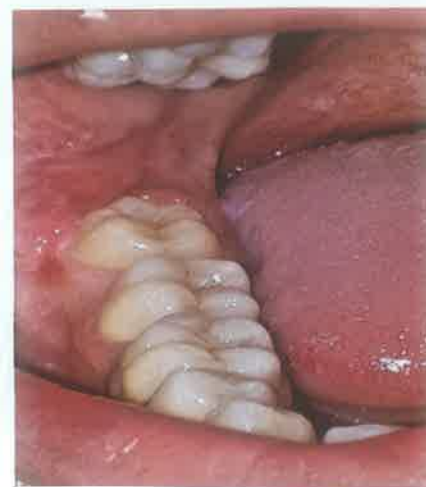
Slika 1. Klinički nalaz perikoronitisa.