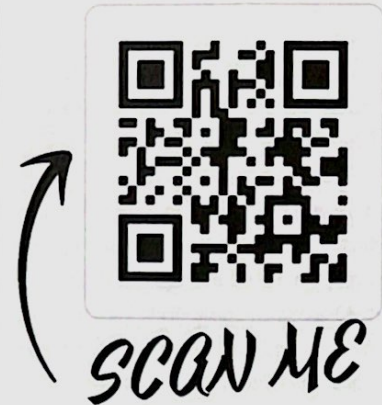
Slika 1. Smjernicama za poticanje razvoja e-profesionalizma tijekom studija medicine i dentalne medicine možete pristupiti putem ovog QR koda ili na službenoj stranici Medicinskog fakulteta Sveučilišta u Zagrebu https://mef.unizg.hr/smjernice-poticanje-razvoja-e-profesionalizma-tijekom-studija-medicine?bn

termin profesionalizma želimo očuvati u eri društvenih mreža, potrebno je držati se smjernica za poticanje razvoja e-profesionalizma i uputa kako se nositi sa svim izazovima koje društvene mreže donose sa sobom te pronaći najbolji na-